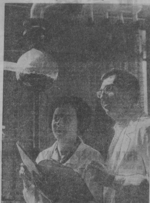
Меҳнат Қизил байроқ орденли химия ва ўсимлик моддалари институти