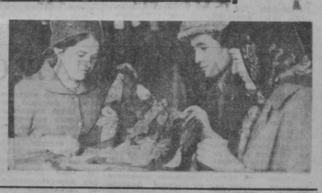
Районда В. В. Куйбишевга бағишланган хиббон бор. Бу хиббон меҳнаткашларнинг энг севимли мактабига айланган.