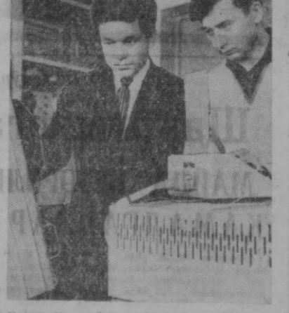
Меҳнат Қизил байроқ орденли кибернетика институти ўқувчи халқ хўжалиги аҳамиятига эга бўлган катта проблемалар юзасидан илмий тадқиқот ишлари олиб борилди.

Мен қайси бир азг унинг қўли урмай, доҳийимиз В. И. Ленин асарларига муружат қиламан, у билан мақоладашман. Ундан битмас-туган куч-қудрат оламан. Ильич мен учун ҳаммаша илҳом манбан бўлиб хизмат қилади.