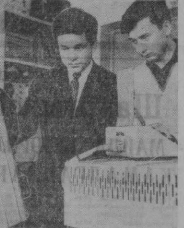
Мехнат Қизил байроқ орденли кибернетика институти мўҳим халқ хўжалиги аҳамиятга эга бўлган катта проблемалар юзасидан илмий тадқиқот ишлари олиб борилади.