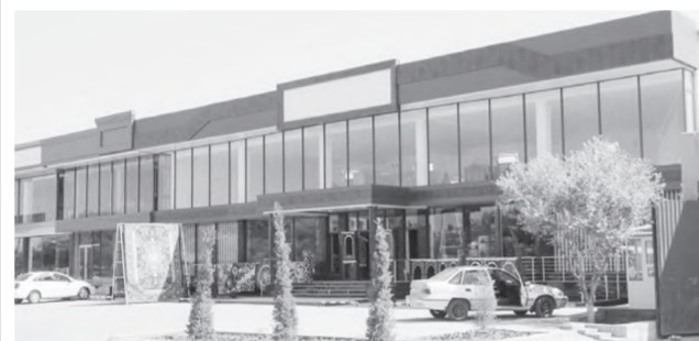
Суратда: "Кўқон" эркин иқтисодий зонасида лавҳа

"Кўқон" эркин иқтисодий зонасидаги корхоналарни модернизация қилиш, техника ва технологик жиҳатдан янгилашга доир дастурларнинг амалга оширилиши ишлаб чиқарилаётган юқори сифатли маҳсулотлар тури ва ҳажмини кўпайтиришда муҳим омил бўлмоқда.