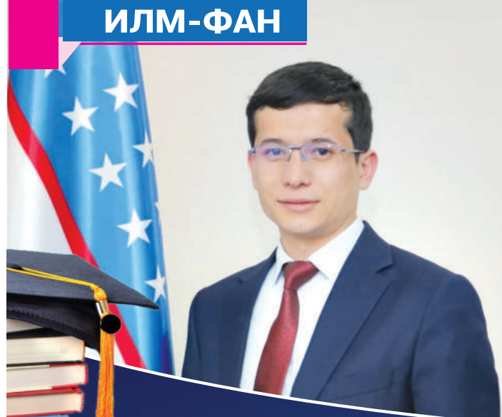
Юсуф АБСОАТОВ, олий ва ўрта махсус таълим вазири ўринбосари