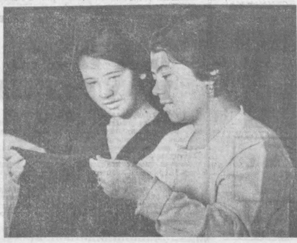
БУХОРО. Тельман номидаги Бухоро трикотаж фабрикаси ҳозирги замон ускуналари билан жиҳозланган илгор норхоналардан бири. Бу ерда ахли коллектив ишлабди. Бу йил фабрика планга қўшимча минглаб трикотаж буюмлари бериб, кўпгина хом ашёни тепаб қолади.

Борхонада ишчиларнинг меҳнатга рағбатлантириш, мукофотлаш тартиблари ҳам янгича ташкил этилди. Заводнинг фондларини яратиш планини бажаришни тўғри рағбатлантириш учун ажратилган маблағлар икки ҳисса ошди. Ёлғиз 1-цех коллективнинг ўзининга бир ойлик фидокорона меҳнати учун 700 сўм миқдорда мукофот олди. Илгари эса бу сума 150 сўмдан ошмасди. Социалистик мусобақада биринчи ва иккинчи ўринни эгаллаган цех-