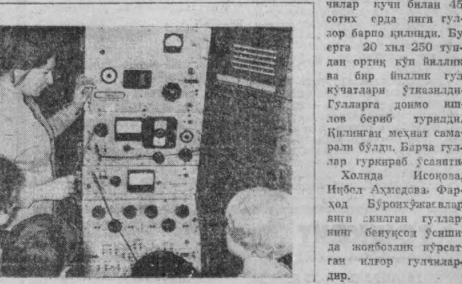
Холда Исогова, Нибол Аҳмедова, Фарҳод Буронхўжаевлар янги экилган гулларнинг беуқсоз усинида жойбозлик кўрсатган илгор гулчилардир.

биан мактабда «Гулчилар отряди» ташкил қилинди. Отрядга IX-синф ўқувчиси Мастура Рустамова раҳбарлик қилмоқда. Отряд аъзолари гул экиш ва уни парвариш қилиш ишлари билан доимий шуғуллашиб борадилар. Гулчилар кучи билан 45 сотих ерда янги гулзор барпо қилинди. Бу ерда 20 хил 250 тудан ортиқ кўп йиллик ва бир йиллик гул кўчатлари ўтказилди. Гулларга доимо ишлов бериб турилди. Қилинган меҳнат самарали бўлди. Барча гуллар туркираб ўсайпти.