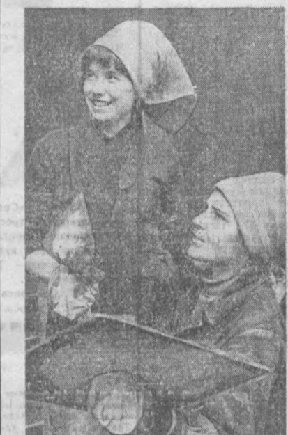
«Главмосстрой»га қарашли 169-пардозлаш бош- қармасининг биндорлари шахримизнинг «Мар- ноз.1» вилоравида 40 квартираларни уйим пардоздан чиқарайтирлар. Яна бир неча кундан сўнг бу уйда ҳовли тўғайи ўтказилди.