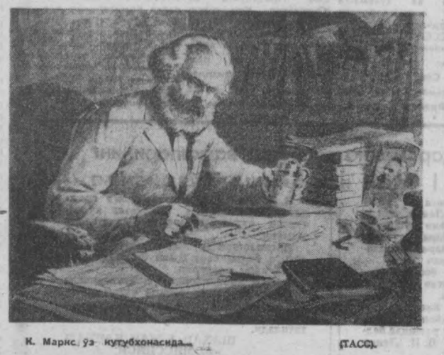
К. Маркс ўз кутубхонасида

Г. ВОРОНИН, ТАСС мухбири, Горький шаҳри.