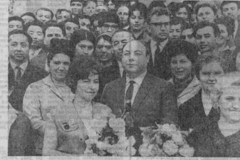
СУРАТДА: бир группа москвалик стоматологлар Ўзбекистонлик стоматологлар орасида.

Москва мутахассислари беморларни қандай қабул қилаётганлари, қандай муомала билан, қандай даволаётганлари ҳамма-ҳаммаси шаҳримиз стоматологлари учун жуда тоғривул бўлди.