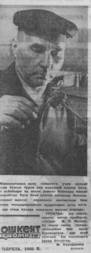
Мамлакатимиз ҳақиқатлиги учун кўпгад муҳим бўлган турли хил мураккаб ишларни амалга оширишда ушбу қизиклиги билан...