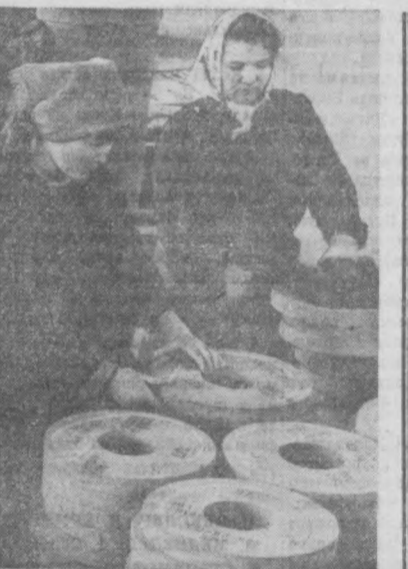
Тошкент абразив комбинатининг меҳнатсевар коллективи беш йиллик буюртмаларини ўз вақтида тайёрлаб бераётди. Мамлакатимизнинг кўпгина машинасозлик санатидида қўлланиладиган бу завод маҳсулотларига бўлаётган талаб йил сайин ортомқда.