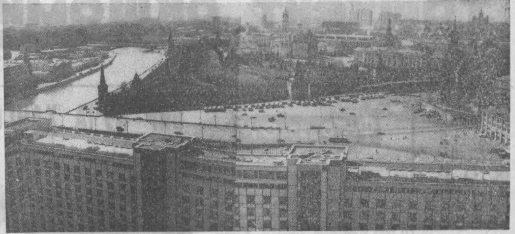
Кремльнинг «Россия» меҳмонхонасидан кўриниши.

ЎЗБЕКИСТОН КП ТОШКЕНТ ШАҲАР КОМИТЕТИ ВА ТОШКЕНТ ШАҲАР СОВЕТИНИНГ ОРГАНИ