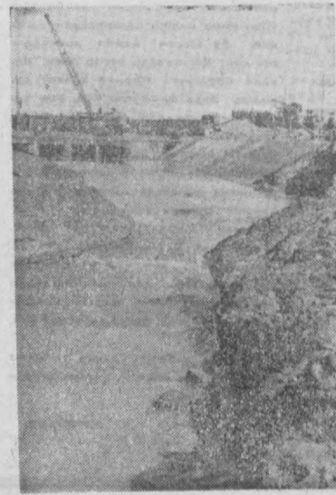
СУРАТДА: Сурхон дарёсидаги «Занг» каналга қатнаши. Қурилишнинг бош майдони. (ЎЗАТГ фотоси).

1918 йилнинг май ойи. Мамлакатда очарчилик, қурғончилик ҳўим сўрпоти. Кўпгина қорхоналар тўхтаб қолган. Темир йўллар «мажолсиз» ҳаракат қилди. Ёш Советлар республикаси учун ана шундай оғир ва машаққатли пайтда пролетариат доириси В. И. Ленин Туркистонда сугориш ишларини олиб бориш ҳақидаги декретни имзолади. Шундан кейин мамлакатда умумхалқ ҳаракати бошланди. Питер ва Москва олимлари ва мутахассислари тушган шешенлар Туркистонга етиб кела бошлади. Уларни бу ерда қўриб қолган наҳаллар, гидроузеллар, бир неча асрлардан бу бир қатра сув кўрмаган ерлардаги ишлар кутиб турарди. Уш пайтда Туркистонда эшик ишлари ўн баробар қисқариб кетган эди. Халқ хўна. лгини оёқча тургазиш учун жуда ҳам зарур чораларни кўриш лозим эди. Партия ва ҳўчумат ана шу намчиликларга барҳам бериш мақсадида тегишли чоралар кўрди. Шундай қилиб, Ўзбекистонда сугориш ишлари юришиб кетди. Бугунги кунда 24 минг гидроузел, 140 минг километри канал ва коллектор, 3,5 миллиард кубометр сув сақланадиган 11 омбор бунёд қилинди, 10 миңглаб ер қазийдиган механизмларга эга бўлинди. Ўзбекистон ана шундай улкан ишлар вазига қудратли республикага айланди. Иттифок бўйича тайёрланаётган пахтанинг 70 процентини республикамиз этназиб бераётир. Сув ҳўжалиги ишлари ой сайини, кун сайини кўпайиб борапти. Ҳозирги кунда ирригаторлар олайид Амударёда Тулғуйин гидроузелини, Аму-Бухоро каналининг иккинчи навбатини, Катта Наманган каналини, бир қатор сув омборларини бунёд этиш вазифини тўрибди.