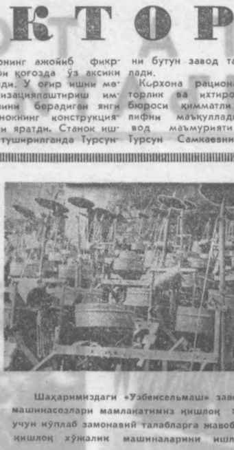
Шаҳаримиздаги «Узбексельмаш» заводнинг машинасозлари мамлакатимизни қишлоқ хўжалиги учун кўплаб замонавий талабларга жавоб беришни...