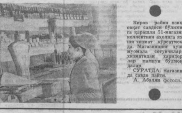
«ТОШКЕНТ ОҚШОМИ»ДА БОСИЛГАНДАН КЕЙИН