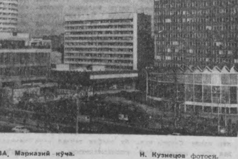
ВАРШАВА, Марксий кўча. Н. Кузнецов фотоси.