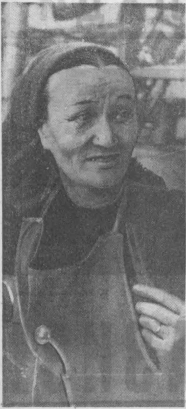
Тошкент асосоволия заводи тоблар...