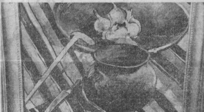
З. Хабибуллаев «Помир натюрморти».