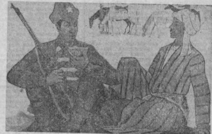
Р. Сафаров «Жанговар йиллар».