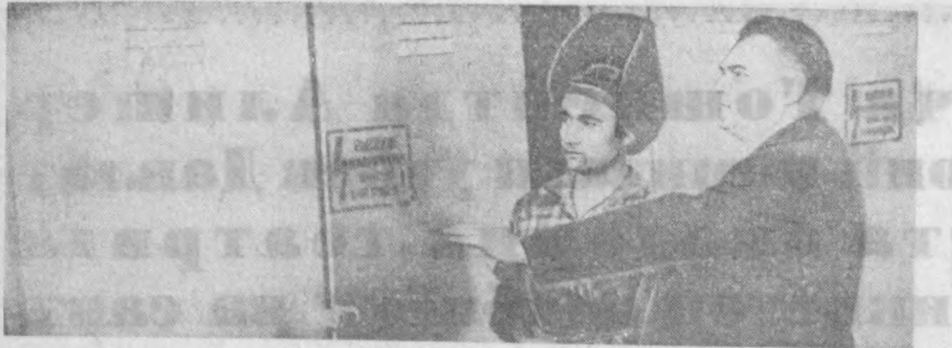
Тошкентдаги республика элктр.механика устaxonаларининг энерсетин ишчилари мамлакатни...