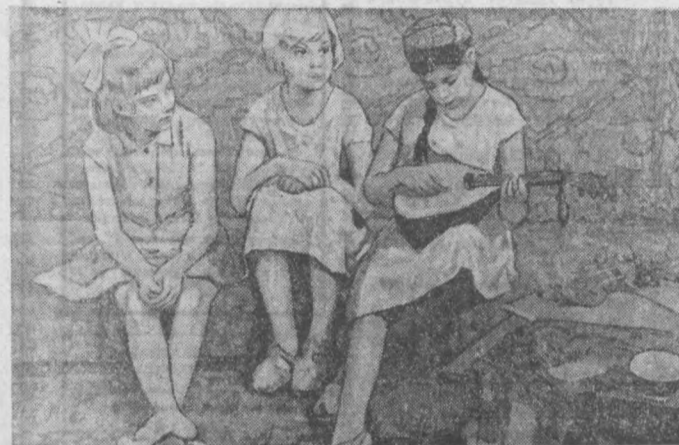
В. Брайчева «Дугоначалар».