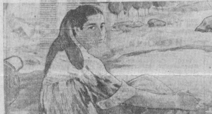
В. М. Боборикхин «Рушанкалик аёл».