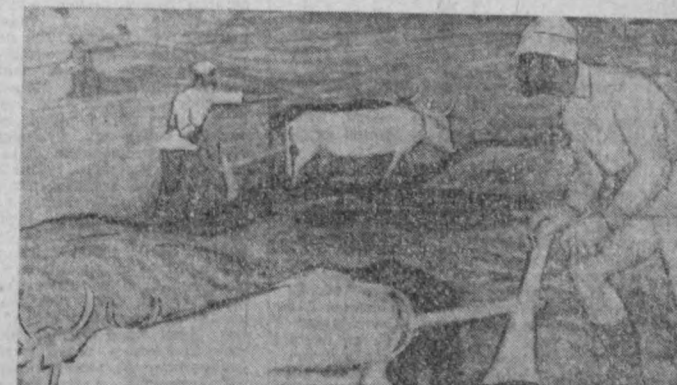
Р. Сафаров «Тинчлик йиллари».