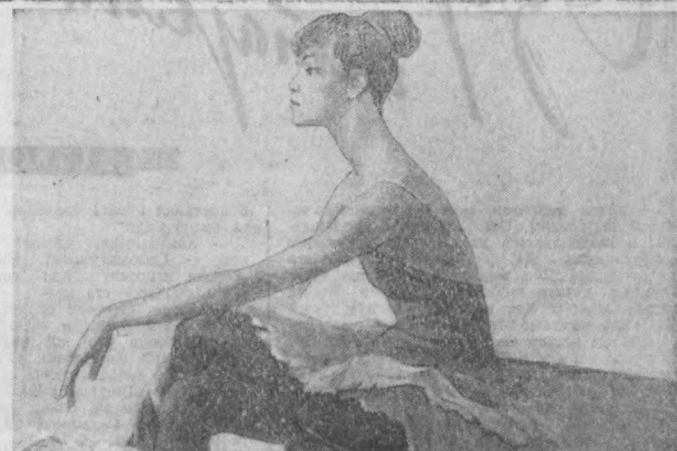
И. Лисинов «Рақоса Малика Собированинг портрети».