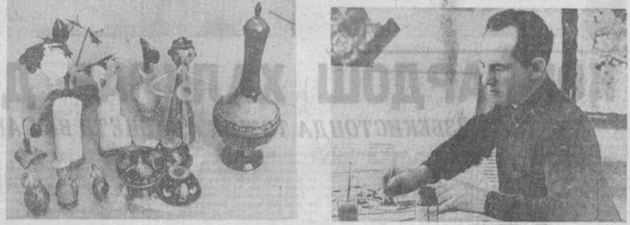
Шаҳаримиздаги «Совгалар» фабрикаси ишлаб чиқараётган турли хил эсдалик маҳсулотларига бўлган талаб мамлакатимиздагина эмас...