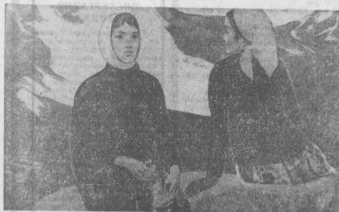
Р. Абдурашидов «Дугоналар».