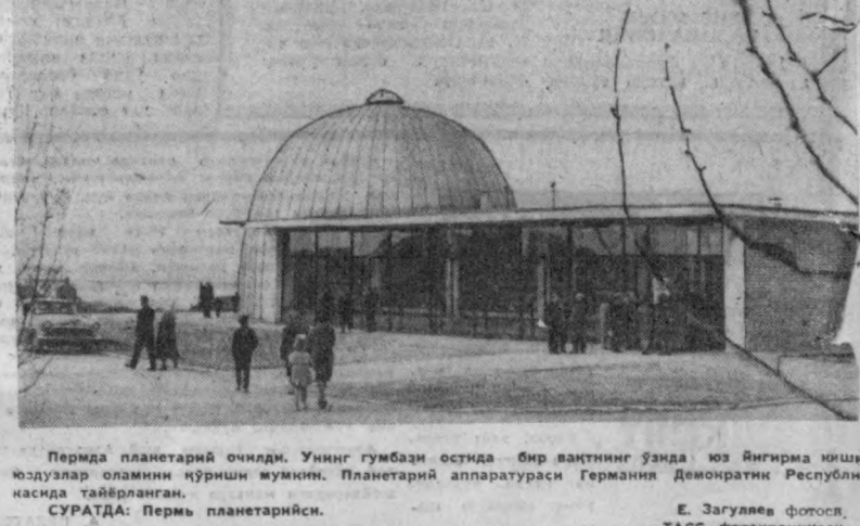
Перма планетарий очилди. Унинг гулбази остида бир вақтининг ўзиди юз йилгича юшми юздулар ойланин кўриши мумкин. Планетарий аппаратураси Германия Демократик Республикасида тайёрланган. СУРАТДА: Пермь планетарийси.

билан маслаҳатлашиб олишди, чунки Тошкент музейи Уша Марказий музейининг филиали бўлиб қолади. Бионинг ташки қавати кино зали, кутубхона, ёрдамчи бинолардан иборат бўлади. Архитекторлар бионинг бутун қиёбасида ўзбек миллий меъморлигининг энг яхши анъаналарини кенг акс эттиришни ният қилмоқдалар. Егоч ва ганча ўйиб нади солидиган халқ усталари залларни безатишга жалб қилинади. Бу бинога энг янги қуриляп материаллари билан бир қаторда республикамизда қазиб олинган гранит ва мармар ҳам хусн берилади. Бу музей В. И. Ленин майдонини ёнида қурилади ва майдон архитектура ансамблининг таркибий қисми бўлади. Бионини қуриш учун Ленин ва Самарқанд кўчалари, Ленинград кўчаси ва Тошкент меҳмонхонасининг биноси билан чегараланган территория ажратиб берилади. Илчй туғилган кунинг 100 йиллигига бу бино қуриб битказилиб Ўзбекистон пойтахти хусинга хусн қўшади. (ЎТА).