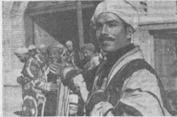
«Тожиқфильм» студияси яратган (чапдан) «Неракли одам» ҳамда «Хиёбат» фильмларидан кадрлар.