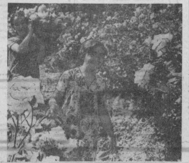
Раиқ баранг гуллар чаман бўлиб очилган. Атрофда муаттар хнд энчиб ётипти. Кўрганнинг кўзи кувониб, дили роҳатланган.

Чаман айлар гул поёндо, Мен ҳам борсам, сен ҳам келсанг. Қанда қилмай ҳар баҳор, Ёз Мен ҳам борсам, сен ҳам келсанг.