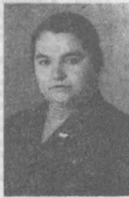
Қаёқларда баъзан камчиликлар учраб туради. Суҳбатимиз давомида уртага ташланган бу нуқсон унинг ўзининг тортиноқлиги, шу кунга қадар эзганларини бирорга кўрсатиш келганлигини эътироф қилиб...