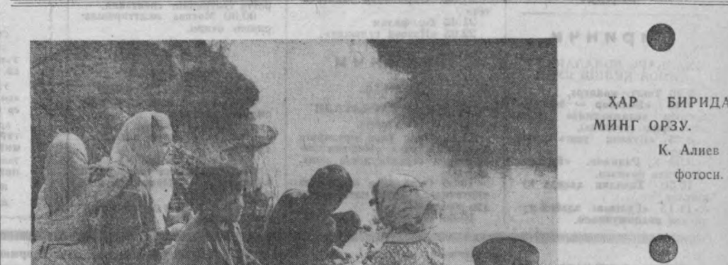
ХАР БИРИДА МИНГ ОРЗУ.

Эртага истиқболимиз раиқ болаларни ҳимоя қилиш ҳалқаро кўни. Боланим, нани юри. Алдингиз юмушларин илб, боғчангга мен ўзим олиб бораман.