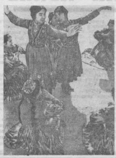
Охунбобоев номидаги шаҳар Маданият уйи қошида турли-туман тўғараклар мунтазам ишлаб турибди.

Пролетариатни и и т куллариғача бўлган мумкин. Музей хотира улуғ доҳийси В. И. Ленин тутилган куннинг 100 йиллигини нишонлаш олдидан кизинг тайёргарлик кетаётган бир пайтда Чилонзор районидagi 104-мантаба ўқувчилари ва ўқитувчилар коллективи доҳийнинг фаолиятини ақс эттирувчи музей ташкил қилдилар.