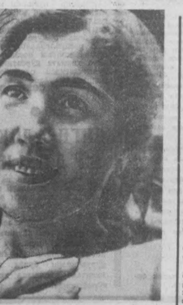
Тошкентдаги «Учқун» тузимачилиги галатеция фирмасининг ишдан коллективни беш йиллик топшириқларини мўддатдан илгаридан адо этиш ҳақида кенг халқ истаъмода товарларини кўпга ишлаб чиқаришга аҳд қўриган ороҳона коллективларидан биридир.