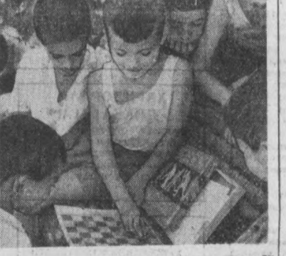
Егги каникул кўнчилидагидек ўтати. Мана бу болалар «Пионерская зорья» лагерига дам ол-гани нелиб, бир-бирлари билан дикн, қалдрон бу-либ қолншди. Лагерь ҳаёти болаларни жуда ақила қилиб қўйди.

Атрофда ота-оналар. Кичкинтойлар ҳая-жони улар чехрасига ҳам кўчган. Ҳатто ўт-ташлар ҳам қўнчили бўлишарди.