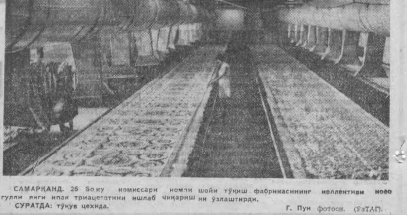
САМАРҚАНД. 26 Бо ну новиссари номли шойи туқиш фабрикасининг коллективни новоб гулли янги ишак триақсатини ишлаб чиқариш и ўзлаштириди. СУРАТДА: туғув чехида.

Алоҳида эзилган «0768» сонли дори ишлаб чиқарилган вақт ва сериясини билдириш, иккинчиси — «0768» яроқлилик мўддатини қўришга. Биринчи сондаги охириг икки рақам — дори тайёрланган йили, унинг олдидаги икки рақам — 01 ишлаб чиқарилган ойна ва бошлангичдаги икки рақам — 26 шу дорининг сериясини қўришга. Яқин бу дори 1968 йил январь ойида ишлаб чиқарилган бўлиб, 26-сериядир.