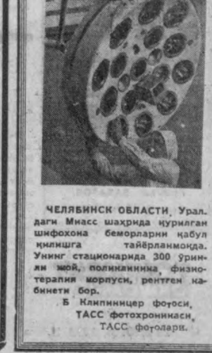
ЧЕЛЫНСКИЙ ОБЛАСТИ. Уралдаги Миасс шаҳрида қурилган шифонахона беморларни қабул қилишга тайёрланмоқда.

Польша ва бошқа мамлакатларга экспорт қилди.