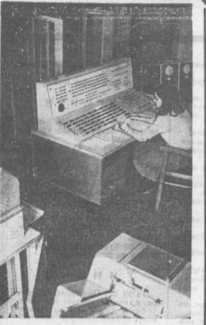
Ригадаги Петр Стучки номидаги Латвия давлат Университетининг ҳисоблаш маркази Совет Итти-фонидида энг янги марказлардан бири ҳисоб-ланади. Бу ерда 250 юзори малакали инженер-лар — физика-математика факультетининг му-тахассислари ишлашади. Улар илмий тадқиқот ва физика, математика масалаларини ҳал қилиш билан бирга Рига, Ленинград, Москва, Ҳозор ва бошқа шаҳарлардаги норхоналарга амалий ердан кўрсатмади.

радим ва қўлига ишван со-линган, мушт зарбидан юзла-ри кўкириб кетган ақитини кўрдим. Бу Освальд эди. Офицер уамма билан бирга кетди. Кейинчалик мен қанда-дентнинг ўлдирилиши ҳақида-нинг протоколлари меннинг маълумотларим кўрсатилма-ганини билдим. Барар эди. Улар полицияга ўйлаб топган режмага мос келмас эди. Мен президентини олд томондан отишган деб қисоблардим. Расмий маълумотларда эса унч фақат орқа томондан отишган дейлади. Мен яра-дор қилган ўқ қотилчи эди. Хуллас мен ноўрин гувоҳ бў-либ қолдим. Расмий маълум-отларга қараганда бер-йўғи бешта ўқ отилган. Икки ўқ Кеннедига, унчиси губернатор Коналига теккан, тўрт-тинчиси ҳеч кимга тегмаган, бешинчиси эса сакраб менга теккан. Ажаб, наҳотки шунча ўқ битта милтиқдан отилган бўлса!