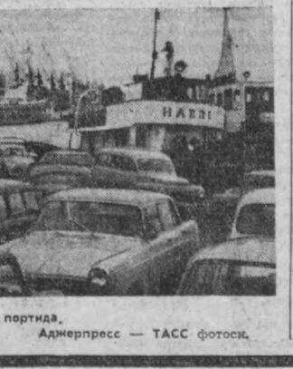
ФИНЛАНДИЯ. Хельсинки портида.

даш ракета ёғдириш ва танкпарварлар билан бўлган қуроли тўқнашш натижасида душман жанг майдонига 35 ўлик ва қрадор қолдириб кетди. Халқ озодлик қуроли кўчалари отрядлари Америка левгаз пёйда қўқилларининг Ихсаниди баҳаси аниқда катта операция ўтказдилар. Америка қўшинларининг мустақамланган позициялари жуда қаттиқ тўнга тутилди. Сўнгра Халқ озодлик қуроли кўчалари отрядлари билан Америка денгиз пёйда қўқиланган ерларни топнишга зўрланд. Америка қўқилонинг бомбардимончи авиацияси ва артиллерияси ишга солди.