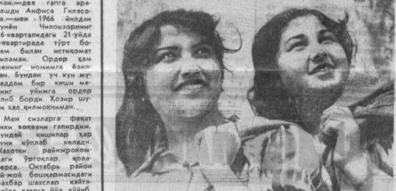
САКСОН ОТА. ДУГОНАЛАР.

Қалбимдаги оташ муҳаббат, Мисраларда қанот қоқайди. Кундан-кунга мурғак юракда, Варқ уради тотли орузлар. Дилда орзу, кучим билан, Қаламимда курли маззулар. Майли қилай беиннат хизмат, Қўларинда қорайсин табиат, Ҳақмасиға розиман, фақат — Фарзандим, деб севсин