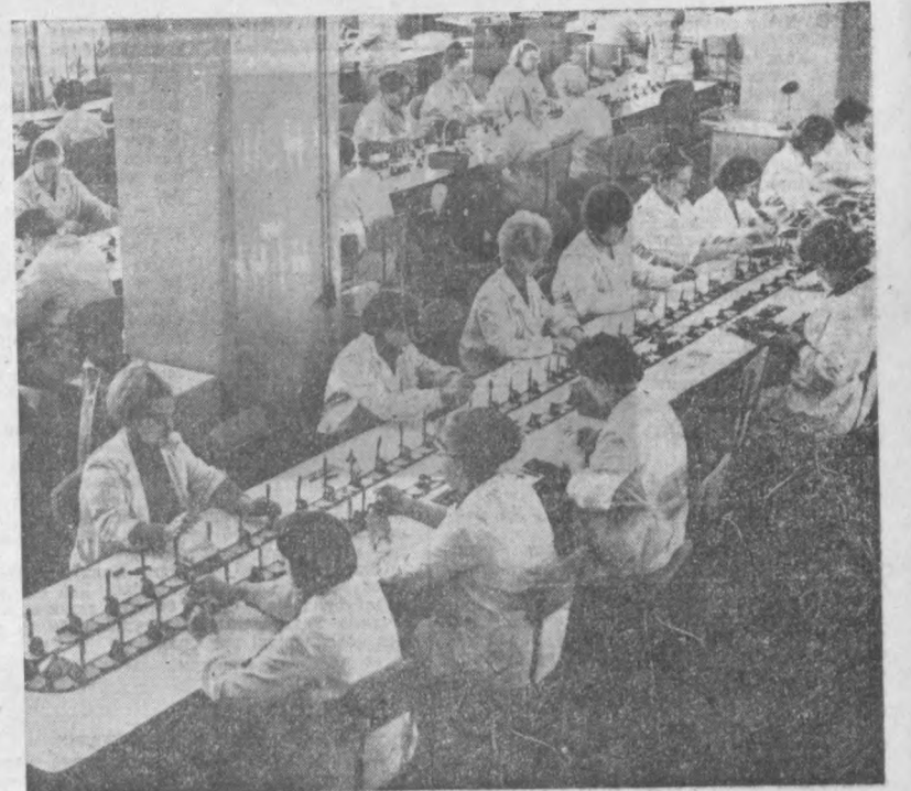
Бу йил Ленинграддаги «Союз» заводи шариклик рўқчалар ишлаб чиқаришни 3 хисса кўпайтирди.