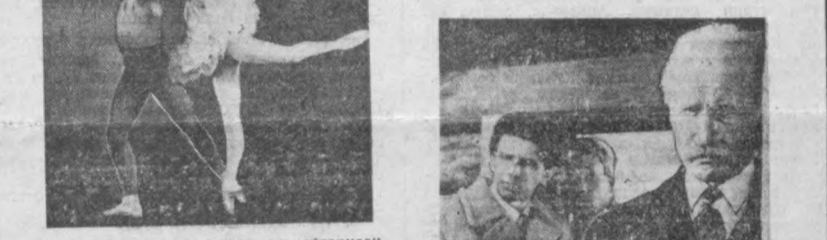
Болгариянинг энг гузал шаҳарларидан бири Варнада июль ойида ёш балет артистларининг конкурси ўтказилди.