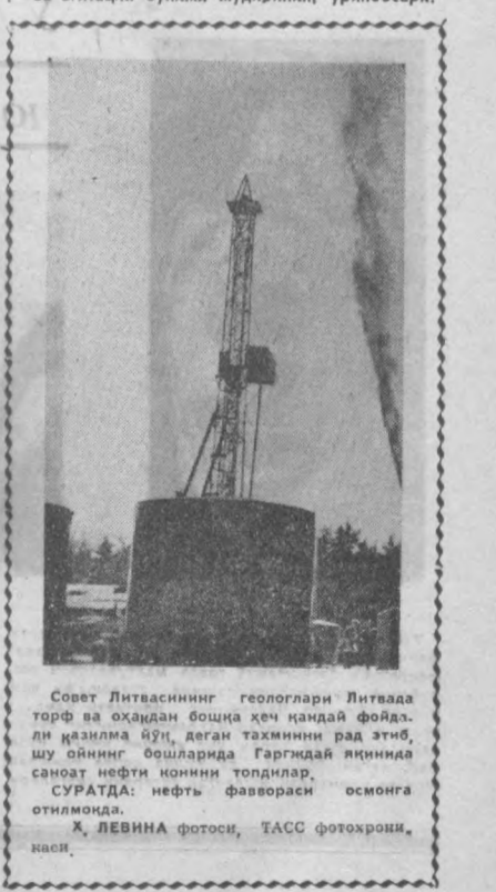
Совет Литвасининг геологари Литвада тоғ ва оҳаддан бошқа ҳеч қандай фойдали қазилма йўқ, деган тахминни рад этиш, шу ойнинг бошларида Гургайда яқинда саноат нефти кинни топдилар.

перспектив иш планини тузиб чиқишни тавсия қиларди. Келгуси ўқув йили учун мактабларини тўғри комплекслаш, олий маълумотли ўртоқлар учун назарий семинарлар уюштириш, баъзи ўртоқларга марксизм-ленинизмни муқтақил ўрганиш учун шароит яратиш бериш керак.