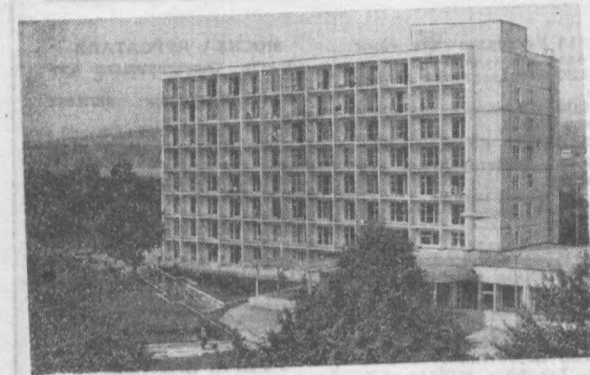
Қабарда — Боллар шифохонасида 83 мавсуми бошланди. Нальчин курортда ўн минглаб кишилар дам олиб, шифо топади.