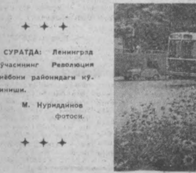
СУРАТДА: Ленинград кўчасининг Революция хёбони районидagi кўриниши.

(ДАВОМИ. Боши газетанинг ўтган соҳлариде).