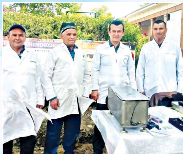
Баҳром НОРҚОБИЛОВ, Ветеринария ва чорвачиликни ривожлантириш давлат қўмитаси раиси