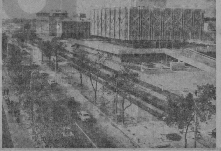
буилмас дўстлиги ва бирдамлиги ўз натижасини кўрсатди.

Ленин музейи ҳақидаги таассуротларини студентлар, ўқитувчилар, мактаб ўқувчилари, ишчилар, ҳарбий хизматчилар, олимлар, пенсионерлар ёзмоқдалар. Уларнинг ҳар бири комму-