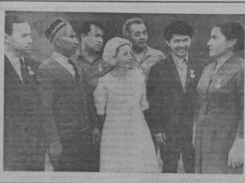
Шахримиздаги 214-мактабнинг педагогик коллективини ўқувчи шаларини тубдан ахшллаш соҳасида олиб борган самарали меҳнати муносиб тақдирлади. В. И. Ленин тугилган кунининг юз йиллиги арафасида мактаб ўқитувчиларидан бир гуруҳмаси Шавкатли меҳнати учун юбилей медаллари билан мукофотланди.