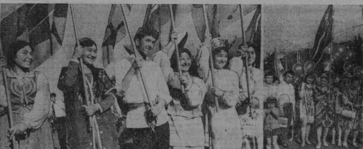
СУРАТЛАРДА: Тошкент шаҳар меҳнаткашларининг В. И. Ленин номи Қизил май донда 1 Май намойиши.