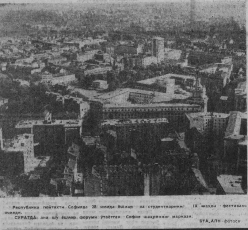
Республика пойтахти Софияда 28 июлда ёшлар ва студентларнинг IX жаҳон фестивали очилди. СУРАТДА: ана шу ёшлар форуми утаётган София шаҳрининг маркази.

СУД ЗАЛИДАН саримсоқ пилезни бошқа шаҳарда сотиб учун тайёрлаб қўганида қулга тушди. — Саримсоқни қарердан олдинги? — Узининки, «Назарбек» совхозда деҳқончилик қилганман, — дея жавоб берди у жамоат тартибини сақлаш ходимларига. Унинг Университет кўчаси. Бог проездедаги 4-уйда саримсоқ тўтул оддий пилез ҳам йиқ эди. «Назарбек» совхозин дирекцияси хужалқда бундай одам ишламаслиги, деҳқончилиги ғирт ёлгонлиги ҳақида саврака берди. Аммо Ортоқов яна бундан келмади. Қандай бўлмасин бу сафар ҳам сувдан қурч қилди 4-уйда ҳаракат қилди. У чайқовчиликни учун олдин ҳам икки марта судланганлиги маълум бўлди. Х. ҲАКИМОВ.