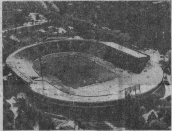
Софиядаги Васлий Левский номдаги стадион 70 минг томошабинга мужмаланган. Ёшлар ва студентларнинг IX жаҳон фестивалини очиб, иш тантаналари мана шу стадионда бошланди.