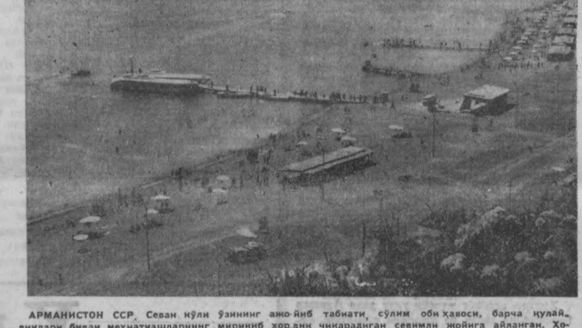
АРМАНИСТОН ССР. Севан кўли ўзининг ани-йиб табияти, сўли би ҳавоси, барча қўла, лиқлари билан меҳнатнашларнинг мириқиб хордиқ чиндарадиган севидали жойига айланган. Хозир бу ерда йилгидек олиш уйлари қурилушига олдириб юборилди. Бу ерда, шунингдек, болалар санаториялари, пионер лагерлари ҳам қуриллади.

СУРАТДА: Севан пляжида. Редактор С. М. КАРОМАТОВ.