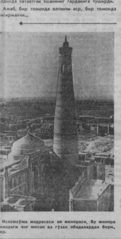
Ислохмук мадрасаси ва минораси. Бу минора Хивада энг юксак ва гўзал обидалардан биридир.