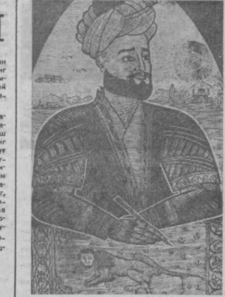
Навоий ва жангирбанд шер.

та, кнопкаларга эътибор қилинг. Шунда ҳамроҳингиз Бордия- уллар немис, француз, рус, араб ва инглиз бўлса суровларига махсус радиофикация орқали жавоб олсангиз, натижада ҳижолатни- дан кутулсангиз, қола- синг. Тўғри, бу ҳозирча орау. Аммо, яқин кун- лар ичида — Гўзал Тошкентимиз ани шун- дай заллари радио- техниканинг энг янги ютуқлари билан жиҳoз- ланган, радиолаштирил- ган, экспонатлар техни- ка воситасида турли оқибoтий тилларда ту-