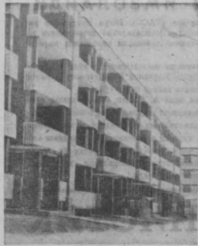
БУ ЧИРОЙЛИ ВА ҲАШАМАТЛИ БИНО ШАХРИМИЗНИНГ. МАРКАЗ—18 КВАРТАЛИДА ҚАД КУТАРГАН. 40 ОНЛАГА МЎЛЖАЛЛАНГАН БУ БИНОНИ ЛЕНИН ГРАДЛИК ҚУРУВЧИЛАР ТОШКЕНТЛИКЛАРГА ҲАЯЯ ҚИЛИШГАН. ДАВЛАТ КОМИССИЯНИ ДУСТЛАРИМИЗ СОВҒАСИНИ АЪЛО БАҲОЛАДИ.