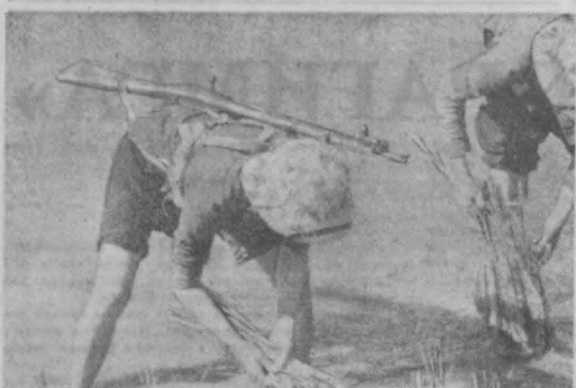
Музофаа отрядларининг жангчи қизлари шоя майдонларида меҳнат қилмоқдалар.