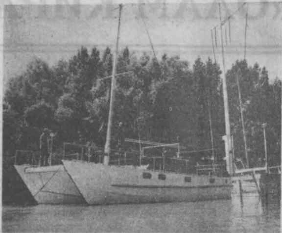
Балаюн кўлига икки юрпусли елканли нема туширилди. Бу неманинг ҳамма қисмлари алюминийдан ишланган. 25 киши ана шу немада экскурсияларга бориши, офтобда тобланиши, чўмилиши мумкин.