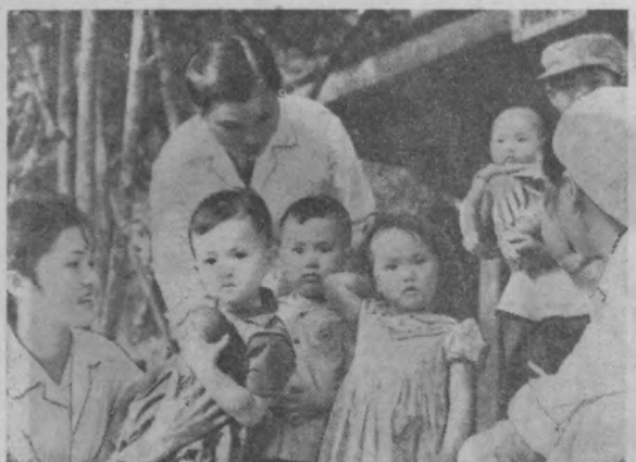
Зануация қилинган район меҳнатнашларининг фарзандлари болалар касалхонасининг шифокорлари томонидан катта гамхўрлик билан чўлғаб олинган.