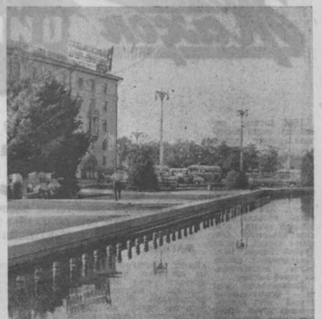
СУРАТДА: Комсомол майдони кўриқчиларидан бири.

лиги блан ном чиқарган. Кангра усталари манаврани жуда гўзал, ёрқин ва кучли, хуллас ақойиб тасвирларидир.