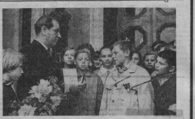
МОСКВА. Янгида СССР ҳақиқатини ютуқлари виставкасининг 1968 йилги беш миллиончи томошани келиб қурди.

ОДЕССА, (ТАСС) Одесса областидаги иттисослашган совхозлар мамлакатнинг шимоллий районидаги махсус ишчиларга дастлаб беш минг центнер узум кўнатилади.