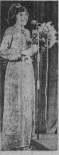
Польшалик дўстлар шаҳримизда ўз гастролларини тугатган, Москва, Ялта, Одесса, Кемерово шаҳарларининг томошабинларига

Шу кунларда серкўш республикамизнинг пойтахти — Тошкент шаҳрида Полша эстрадасининг санъаткорлари меҳмон бўлиб турибдилар. Меҳмонларимиз шаҳримизга ташириб буюришдан аввал Ленинград, Кисловодск шаҳарларида, Махаҷқалада, Ашҳобда ва иттифоқимизнинг бошқа қўшна шаҳарларида бўлишди. Концерт пайтида тошкентлик санъаткорлари жуда ранг-баранг дир.