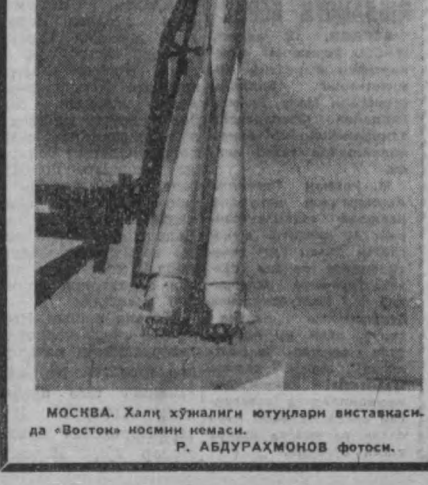
МОСКВА. Ҳақиқатини ютуқлари виставкасининг «Восток» номини немаси.