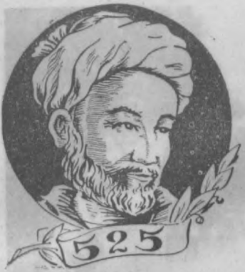
Хаё ўзида ким сизга бир ҳарф ўқитмиш раия ила, Айламак бўлмас адо онинг ҳақни юз

Ленинграддаги дунёга машҳур санъат қошонаси Ленин ординат Давлат Эрмитажиде бўлсангиз «Шарқ маданияти» бўлимидаги бир тарихий ҳужжат диққатингизни тортиди.