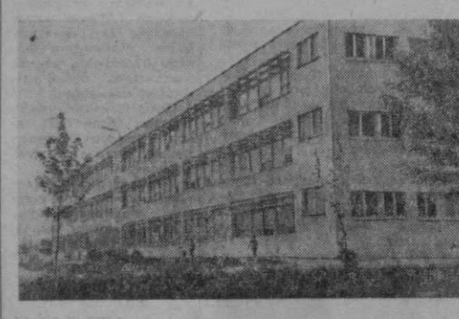
«Бешқайрағоч» массивида янгидан-янгидан магазинлар, маиший хизмат кўрсатиш тармоқлари, богча ва мактаблар бунёд этилмоқда. СУРАТЛАРДА: унда — ана азамат қурувчиларимиз совга этган мактаб биноси.

ЭЛТИЛА қанчадан-қанча хотандилар бошига тушган офат бўлди. Ана ушунда «Қорғон», «Мерганча» маҳаллалари, Жаркуча, Зардор сингари кўчалардаги иморатлар вайрон бўлди.