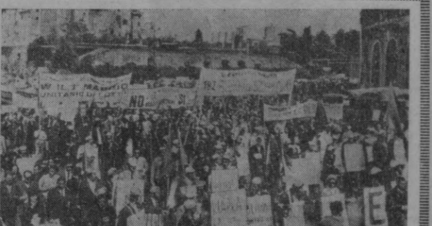
Италия ишчиларининг ўз ҳўжўлари учун нураш бир кўнга ҳам тинимлашти. Меҳнатқилар катта социал ва иқтисодий реформалар ўтказишнинг талаб қилмоқдалар. СУРАТДА: Римдаги қадимий Колизей девори яқинда умумий халқ забастоваси пайтида ўтказилган кўннинг иккинчи кўниги.

БУДАПЕШТ. МТИ агентлиги хабар берилади: Бу йил Венгриянинг нефть саноати 6 миллион тонна нефтни қайта ишлаб берилади. Сазахаломбатда йилга 6 миллион тонна нефтни қайта ишлаб бериладиган Дунай нефтин қайта ишлаш комбинати 1975 йилга ишга туширилади. Бу йил Тисса нефтин қайта ишлаш комбинатининг биринчи навбатини қурилади бошлайди. Комбинатининг биринчи навбатини йилга 3 миллион тонна нефтни қайта ишлаб бера олади. (ТАСС).