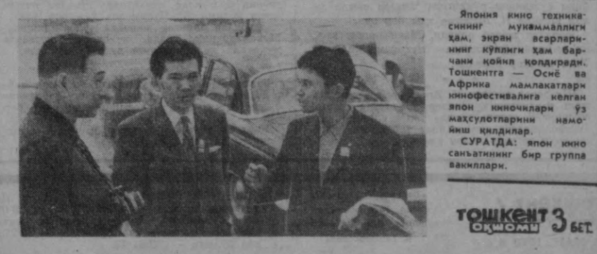
Япония кино техникасининг муваффақлиги ҳам, экран асарларининг қўнгли ҳам бар- чанам қўйиб қолдиқредди. Тошкентга — Оснэ ва Африка мамлакатларини инновативалига келган япон киночиларини ўз маҳсулотларини намо- иши қилдилар. СУРАТДА: япон кино санъатининг бир гурупи вакиллари. ТОШКЕНТ 3 БЕТ. 25 МАЙ, 1970 йил.

ҚўШИҚ Ювиб чиқарилар ўлкадан деган Ўлкан бир умиддан еришар қўнгли, Қайиқ миниб Шангана Кўйи ёқда сузар дарё ёқалаб, Дарё болалар денгизга қараб, Қайиқ миниб Шангана эса Сузар қўйлаб, М. Аъзамов таржимаси.