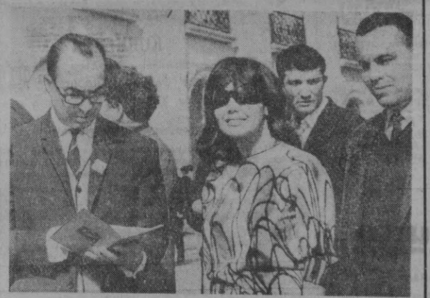
Бирлашган Араб Республикасининг киносценарист ва актёрлари Тошкентда ҳамжиқсаблари билан фильм алмашдилар. Дўстлик шаҳрини томоша қилдилар. Шарқ дарвозаси Тошкент уларда натта таассурот қолдирди. СУРАТДА: Бирлашган Араб Республикасини киночилари.

Чиндан ҳам қорасан, эй Қора денгиз, Тўқилларинг шовқинида исён кўпирар. Қора сув юзида, нема ортда — Ғалаба ва ўлим — қизил тўқиллар. Иккига муваддас раҳимини ёшимин Кимнингдир худидор қўлларини бунда. Фойдалар бирдоби — манг тўқини юз бели, Ўн еттинчи йилнинг даҳшати шунда. Жануб денгизидан қачондир тонгда, Тўқиллар парчалаб тик қойларни. Сенга томон осар жануб шамолни. Ишқилоб раҳимидан қўзғатар сени. Сен бир вақт Лениндан ўрганган каби, Ярқироқ из солиб сенинг изиндан. Эсар у, тақрорлар ўтли йилларинг, Неён тақрибасин ўрганар сендан. Рухсат бер: «Потёмкин» ҳарбий кемаси, Келажак деб сўзсин денгизлар оша. Ҳайбат-ла суусингу, нуфус нурида, Ол байроқ қилираб турсин ҳамини. Қ. Кенжабоев таржимаси.