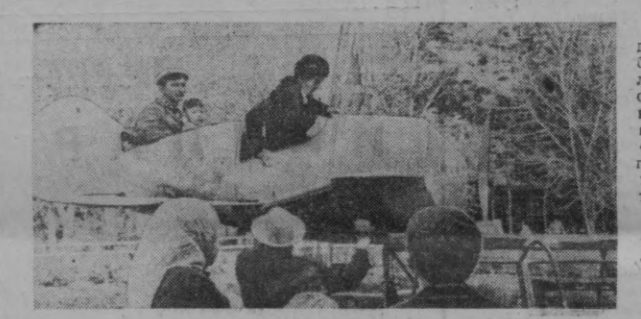
Шаҳримизнинг маданият ва истироҳат боғларида меҳнатқиларнинг кўнгилли дам олишлари учун барча имкониятлар яратилган. Шу кунларда «Галаба» боғида кўнглик оғир аттракционлар ишлаб турибди. СУРАТДА: маданий ҳордиқ чиқариш пайти.