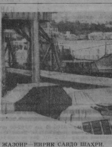
ЖАЗОНР—ПИРИК САВДО ШАҲРИ.