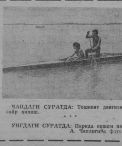
ЧАПДАГИ СУРАТДА: Тошкент денгизда сайр қилиш. ЭНГДАГИ СУРАТДА: Паркда оқшом пайти.

Оқ тани врач топган касаллик бу икки дўстга баравар оғир нусбага келтирди. Уасса дўстининг азобини бирга тоатиб, унга ҳамроҳ бўлишга рози эди.