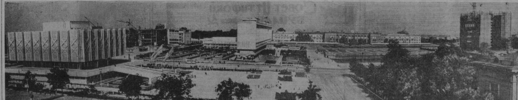
БҲУНГИ ТОШКЕНТ. Ленин номли майдоннинг умумий кўриниши.