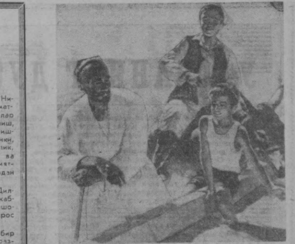
Рассом В. Петровнинг «Сув келди» бадийи полотноси.