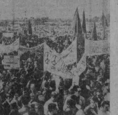
ПАРИЖ. Вьесей урмондаги мингнинг умумий кўриниши.

АНҚАРА. Туркия Республикаси пойтахти аҳолиси бир ариқ миллионга яқинлашиб қолмоқда. Анатолий агентлиги Анқара му-