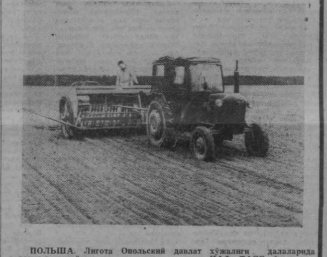
ПОЛЬША. Лигота Оповский давлат хўжалиги далаларида дон экиш пайти.

Х. ТАҲАХАСИ, япон журналисти. (АФП). Токио.