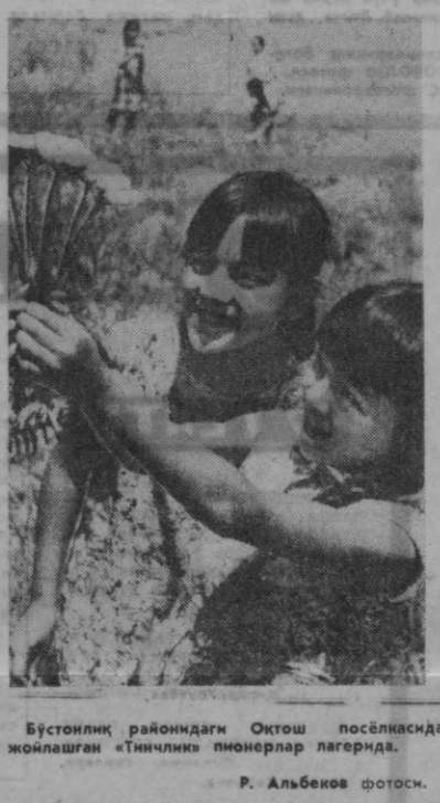
Бустонлик райондаги Оқтош посёлкасига жойлашган «Тинчлик» пионерлар лагерига.

Агар юзаси яхши-лаб силликланган биллард шарини ердек катталаштирсак, ундаги ўнбир — чункириқлар еркинига нисбатан анча ортиқ бўларкан.