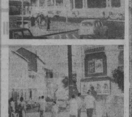
Сиз суратда Дакарнинг марказий кўчаларини кўриб турибсиз.

ПАРИЖ. Франс пресс агентлиги мух- бир Сайгондан хабар беради: 6 минг эъзо- си бўлган докерлар касаба союзи 24 со- ларига умумий забас- товка эълон қилган эди. Сайгон портида ишчи ва хўжайинларнинг ала- қида қолган. Иш ташловчилар иш ҳақ- қининг оширилишини талаб қилмоқдалар.