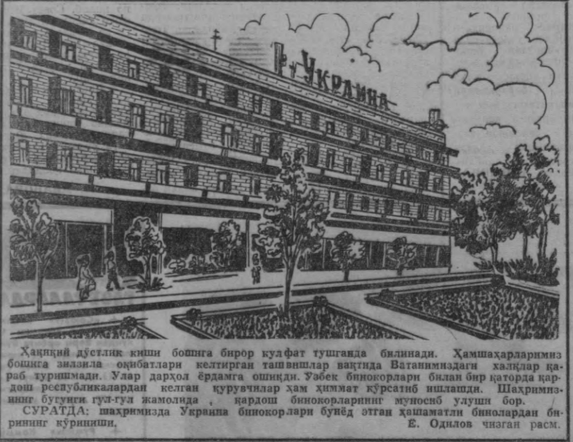
Халқнинг дўстлиги киши бошга бирор қудрат тушганда билинади. Ҳамшаҳарларимиз бошқиса амалиётлар келтирган ташкиллар вақтида Ваганимиздаги халқлар қара-бар қуришмади. Улар дарҳол ёрдамга ошиди. Ўзбек бунёдкорлари бизни бир қаторда қардош республикалардан келган қурувчилар ҳам химмат қўраётди. Шаҳримизнинг бутунги гўл-гул жамлолида, қардош бунёдкорларнинг муносиб улushi бор.