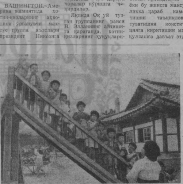
Корея Халқ Демократик Республикасида кичиктоилар учун барча шартлар мавжуд. Бу ерда халққонияти даврида минглаб болча, ясли ва мактаблар қурилды. Суратда: «Чийон» қишлоқ хўжалик кооператив дехқонларининг болалари болча майдончасида.