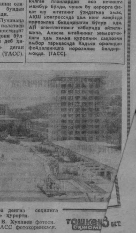
БХР. Варнадаги Қора денгиз соҳилига жойлашган «Олтин кум» пуроти.

ракатларида Исроил қўшинларининг танк қисмлари қатнашмоқда. (ТАСС).