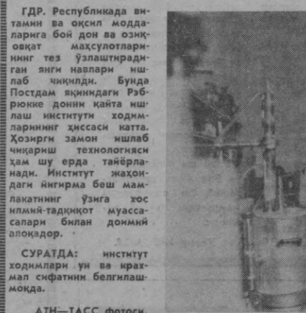
ГДР. Республикада ватанин ва оқсил моддаларига бой дон ва озик-овқат махсулотларининг тез ўзлаштириладиган янги навлари ишлаб чиқилди. Бунда Постдам иқлимдаги Рэбрюкке донин қайта ишлаш институти ходимларининг ҳиссаси катта. Хозирги замон ишлаб чиқариш технологияси ҳам шу ерда тайёрланади. Институт жаҳондаги йигирма беш мамлакатнинг ўзига хос илмий-тадқиқот муассасалари билан доимий алоқада.

ВАРШАВА. Келечдаги «Дўстлик» цемент заводи коллективига Польша Халқ Республикаси министрилар совети ва Польша насаба союзларини марказий советининг кўчма Қизил байроғи топширилди. Коллектив В. И. Ленин туғилган куннинг 100 йиллигига ва фашистлар Германияси устидан қозонилган галабининг 25 йилли-