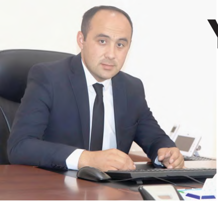
(Davomiy. Boshlanishi 1-sahifada).

Yoshlarning bo'sh vaqtini mazmunli o'tkazish, ularning bandligini ta'minlash bilan ko'pgina