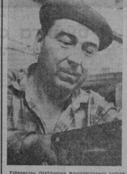
Узбекистон пахтачилик машинасозлиғи заводининг коллективи пахтазорлар ҳамда халқ хўжалиғи учун пахта толасини тортувчи конденсорлар, кўтарма транспортёрлар ҳамда пахта тозаловчи турли жи машиналар ишлаб чиқармоқда.