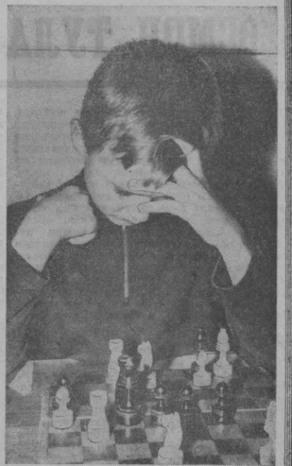
Еш шахматчи.

«Биринчи «жангнинг» биринчи раундда қаттиқ ҳаяжонлангандан кейин бироқ сустанди, иккинчи раундда узини тутиб олиб, ажойиб комбинациялар қилди. Биринчи кун рақибини енгди. Иккинчи кун моҳирлик билан рақибини пол эди. Финалда эса кўпчиликнинг тилига тугаш литвалек спорт мастерлигига номзод Бумборс билан тўқнашди.