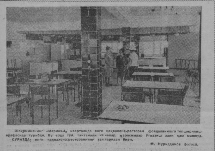
Шаҳримизнинг «Марказ-4» кварталда янги ҳақвахона-ресторан фойдаланишга топширилди.

Ажойиботлар оламида дунёнинг қадимий қарталари. Америка осийлик қадимги сайёҳлар оқган бўлиб чиқди. Ленинградлик шарқшунослар Леа Гумилева ва Бронислава Кузнецова осийлик географлар Америка қитъаси борлигини милоддан каминда бир ярим минг йил илгари билганлар, деб фараз қилмоқдалар.