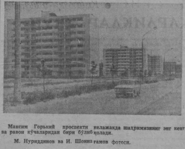
Максим Горький проспекти келажакда шаҳримизнинг энг кенг ва раво кўчаларидан бири бўлиб қолади.

Шу кунларда Тошкент халқ хўжалиги институтини бир қанча факультетлари ва III ва IV курс студентлари завод ва фабрикаларда, совхозларда ўзларининг ишлаб чиқариш практикаларини ўтказишда, факультетлари студентлари эса туқичлик комбинатлари, пластмасса заводлари, каноп фабрикасида, район молчи бўлимида практика ўтказишда, институт бўйича жами 734 студент ўз билимларини амалий ишлар ёрдамида мустаҳкамлашди. Қишлоқ хўжалиги экономикаси факультети студентларининг қозилох ва совхозларида, планлаштириш, ҳисоб-китоб, молчи-иттисод факультетлари студентлари эса туқичлик комбинатлари, пластмасса заводлари, каноп фабрикасида, район молчи бўлимида практика ўтказишда, институт бўйича жами 734 студент ўз билимларини амалий ишлар ёрдамида мустаҳкамлашди.