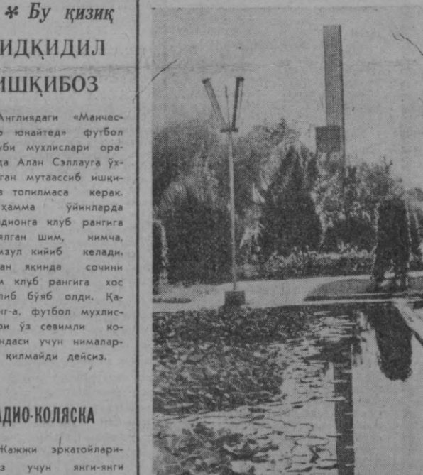
Анҳор буйи гойат сўлим. Бу ерга дам олган келган кишининг чарчоғи бир зумда ёзилди кетади. Минг турли доғ-дархатлар ва гўллар муаттар иси билан қўнглини хўшнуд этади. СУРАТДА: Гагарин номи боғининг бутунти кўриниши.

* Бу қизик СИДКИДИЛ ИШҚИБОЗ Англиядаги «Манчестер юнайтед» футбол клуби мухлислари орасида Алан Сэллауга ўхшаган мутаассиб ишқибоз топиламаса керак. У ҳамма ўйинларда стадионга клуб рангига бўялган шим, нимча, камзул кийиб келади. Алан яқинда сочининг ҳам клуб рангига хос қилиб бўяб олди. Қаранг-а, футбол мухлислари ўз сеvimли командаси учун нималарни қилмайдми дейсиз.