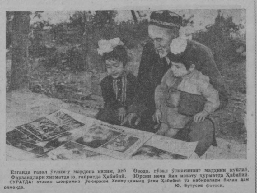
Езганда газал ўғлим-у мардона қизим, деб Озода, гўзал ўлкасининг мадҳини қўйлаб, Фарзандлари хизматда-ю, гайратда Ҳабибий. Юрсин неча йил иззату ҳурматда Ҳабибий. СУРАТДА: отахон шонирини Эронинг Холмҳаммад ўғли Ҳабибий ва набибалари билан дам олмада.