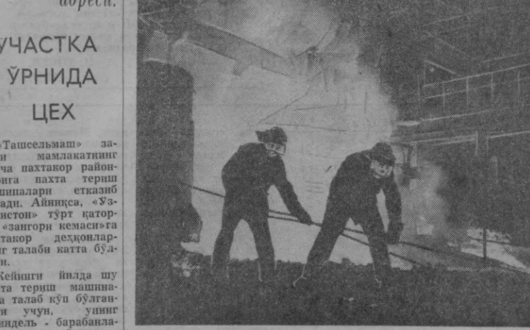
СУРАТДА: мартен пехида пўлат эритиш.