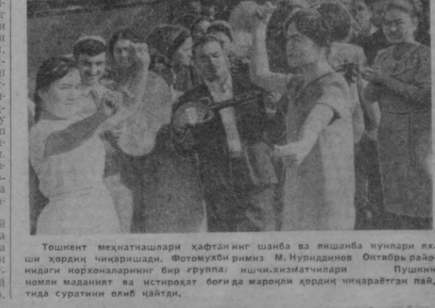
Тошкент меҳнаткашлари ҳафтанинг шанба ва яшанба кўнлари яхши ҳордиқ чиқаришадилар. Фотомухбири ривиз М. Нуриддинов Октябрь районидаги қорхоналарнинг бир гуруҳида ишчилар билан биргаликда дам олиш зонасига йўл олдидилар. Пўшкун номи маданият ва истироҳат боғида мароғли ҳордиқ чиқараётган пай, тнда суратини олиб қайтди.

8 кишига санаторияларга арзон нархда йўлланмалар берилди. Ички кўлик дам олиш ҳам мароқли ўтапти. Бугун эрталаб заводнинг қуов цехи ишчилари Янгийўл районидан «Энлоп кўлаери» ором олиш зонасига йўл олдидилар. Тошкент денгиз яқинида эса ҳозир янги дам олиш зонаси тайёрланган.