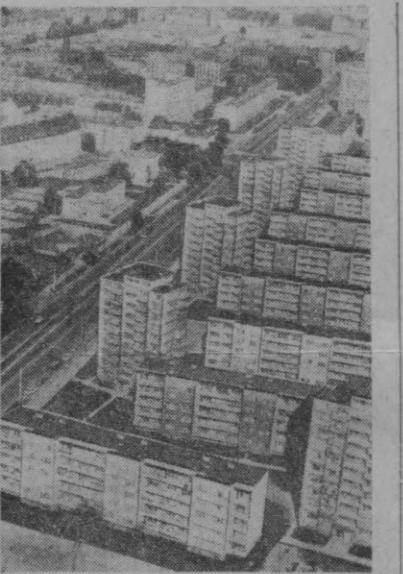
Вроцлав шаҳри чорак аср ичда бутунлай ўзгариб кетди. Шаҳардаги биноларнинг 70 проценти уруш вақтида вайронгарчиликка айланган эди.