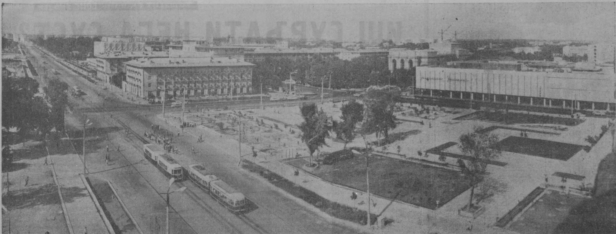
СУРАТДА: «Самарқанд» кўчасининг кўриниши.