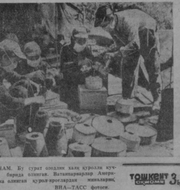
ЖАНУБИЙ ВЬЕТНАМ. Бу сурат озодлик ҳақи қуроли кучларининг базаларидан бирида олинган.