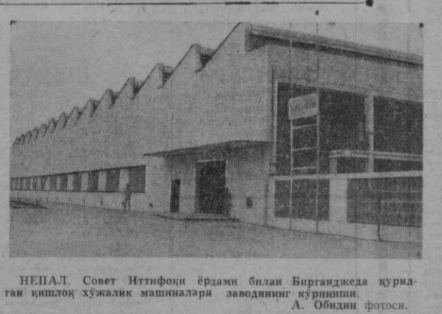
НЕПАЛ. Совет Иттифоқи ёрдами билан Биргандадеда қурилаган қишлоқ хўжалик машиналари заводининг кўриниши.