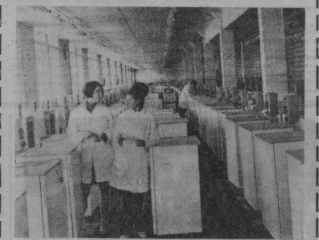
Смоленск холодиликлар заводиининг ишлаб чиқариш қуввати йил сайин ортиб бормоқда. Бу ерда янги снов станцияси ишга тушди, йилга 200 миңта холодилик ишлаб чиқарувчи иғув цехини янхўлаш тугалланди. СУРАТДА: снов станциясининг умумий кўриниши.

Озарбайжонда ва Закавказьеининг бошқа республикаларида ҳар йили 10 миллиард куб метр газ қабул қилиб олишга тайёргарлик қўрилмоқда. Ҳозир трассининг ҳамма участкаларида қурилиш ишлари битай деб қолди. Қурувларнинг асарияти траншеяларга ётирилиб, устига тўпроқ ташлаб қўйилди. Трасса охириги участкасининг дастлабки бир неча ўн километридаги қурувлар газ ва даво билан тўлдирилмоқда. (ТАСС).