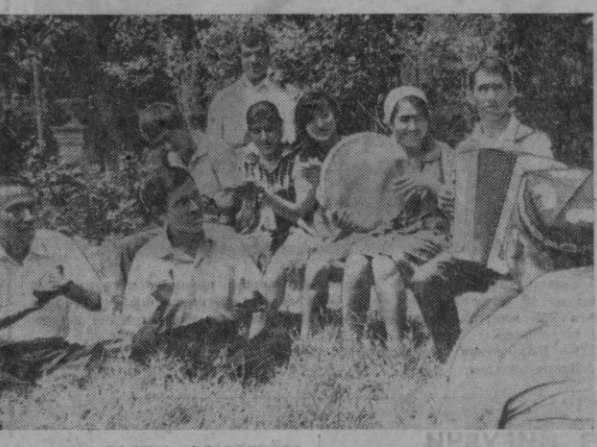
Топшент яқинидаги «Қизил Октябрь» санаторийсида ҳар, йили бир ярим мингга яқин меҳнатқаш мароқидан дам олиб даволанади. Ҳозир бу ерда 250 меҳнатқаш дам олаётир. СУРАТДА: маданий ҳордиқ чиқариш соатида.

Беш йиллик жамғармасига эса планга қўшимча равишда беш юз минг сўм маблағ қўшилди.