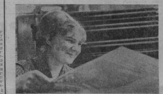
Шахримаздаги офсет фабрикасининг матбаачилари беш йиллик топшириқларини мундатидан илгари адо этиш борасида баракали меҳнат қилмакталар. Корхонанин кўпгина пешқадам ишчилари йиллик топшириқларини бажариб бўлгуси йил ҳисобига меҳнат қила бошладилар.

Иститут педагогика институтининг навбатдаги партисини қабул қилишга қизғин тайёрлик кўрмоқда.