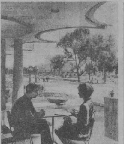
Яқиндагина ишга тушган «Кўк гўмбазлар» кафееси тошкентликларнинг сеvimли дам олиш жойларидан бири бўлиб қолди.