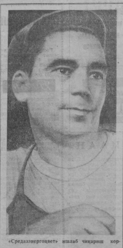
«Средазнерговет» ишлаб чиқариш корхонасининг механика цехи халқ хўжалиги учун қўнига стандарт бўлмаган деталлар ва йирик габаритли қозонлар ишлаб чиқаради. Бу ерда барча буюртмалар ўз вақтида сифатли адо этилади.

Энгельс пролетар интернационалини голларда изчил туриб, Германиядаги лассалларга, инглиз тред уюшмаларига раҳбарлиги зарба берди, прудончиликка, бокунинчиликка ва Интернационалнинг бошқа душманларига қарши шарқатсиз кураш олиб борди. Маркс билан Энгельс интернационалнинг раҳбар органи —