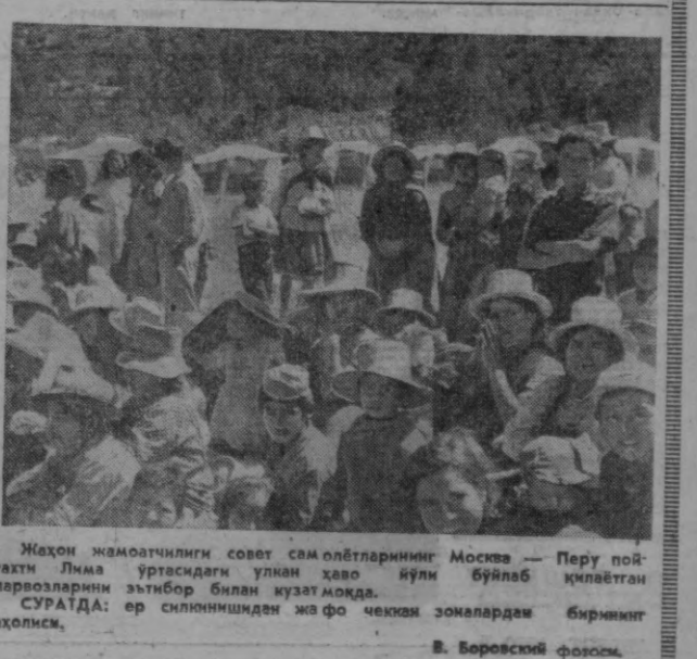
Жаҳон жамоатчилиги совет сам олетларининг Москва — Перу пой-тахти Лима ўртасидаги улкан ҳаво йўли бўйлаб қилаётган парвозларини эътибор билан кўзатмоқда. СУРАТДА: ер силаннишдан жа фо чеккии зомалардан бирининг аҳолиси.

УЛАН-БАТОР. Ке-йинги йилларда Мон-голияда геология со-ҳасидаги илмий тад-қиқотлар кенг ривож-ланмоқда. 1966 йилда Монго-лия Халқ Республика-сини геология илмий тадқиқот институти ву-жудга келтирилди. 1967—1969 йилларда эса Монгол-Совет қўшма комплекс ге-ология экспедицияси уюштирилди. Мон-тазм агентлигининг ха-бар беришича, институт кучлари ва қўшма экспедиция ишлари ту-файли тўрт йил ичи-да янги геология хари-таси, тектоник хари-та ва махсус хари-талар, шу жумладан Монголия Халқ Рес-публикасининг сейс-мик районлари хари-талари тузилган. (ТАСС).