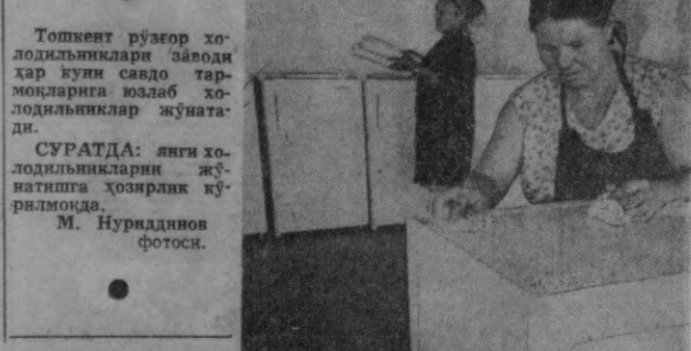
Тошкент рўзгор ҳодимчилик заводи ҳар қуни савдо тармоқларига юзлаб ҳодимчиликларни жўнатади.

Тажрибадан қуришишча, поток ишлаб чиқариш шароитларида «суний қуёш» жорий этилиши товуқларни анча серпушт қилади. (ТАСС).