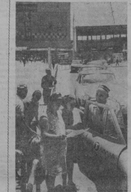
Шаҳар вокзалида ташқил этилган такси диспетчерлик пункти йўловчиларга яхши хизмат кўрсатмоқда. Бу ердан буюртма билан шаҳар атрофидиган дам олиш зоналарига тез ва осонгина етиб олиш мумкин.