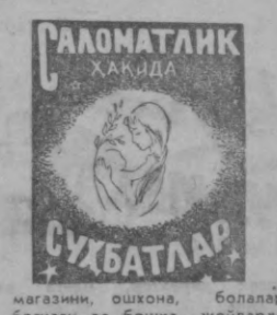
САЛОМАТЛИК ҲАҚИДА СЎХБАТЛАР

Сунги ҳам (қардан олинганда қатъий назар) юқоридаги шартларга амал қилган ҳолда яшаш қайнатиб зарур. Сувдан Фөрқил ўлароқ, ҳам сунг ичак инфециясини қўзғатувчиларнинг кўпайиб кетиши учун яхши ва энг қулай имкон яратиб беради.