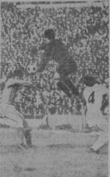
Дарвозабоннинг қўли баланд келди.