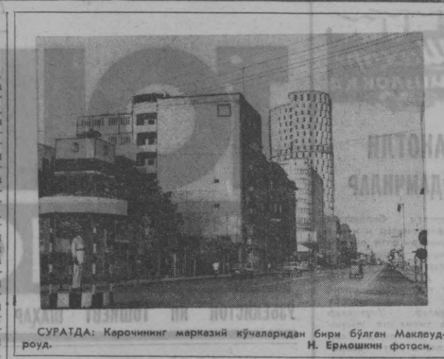
СУРАТДА: Керчининг марказий кўчаларидан бири бўлган Маклеуроуд.