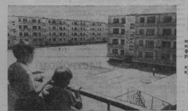
Яқинда «Қўйла»-3 массивида ҳар бири 72 квартиралли бешта уй фойдаланишга топширилди.