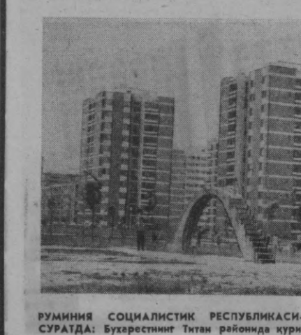
РУМИНИЯ СОЦИАЛИСТИК РЕСПУБЛИКАСИ. СУРАТДА: Бухарестнинг Титан районида қурилган янги турар-жой бинолари.