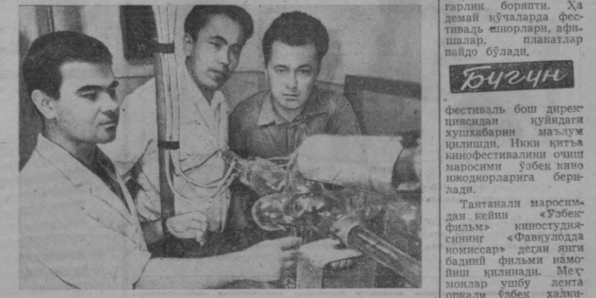
Ўзбекистон ССР Фанлар академияси Электроника институтининг газ электроника лабораториясида бир гуруҳа илмий ходимлар қаттиқ жисмига атом ва ионлар оқимининг таъсирини ўрганишмоқда.

Яна бир ойда янги пойтахтимиз меҳнатқиларни уздаш ҳақида воқеанинг гувоҳи бўлади.