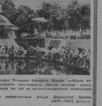
ВАРШАВА. Яқинда кўнлари Лазенки боғидаги Шопен ҳайкали олдига буюн композитор асарларини тингламоқчи бўлган музика шинавалчилари тўпланишди.

КОЛОМБО. Цейлон ҳукумати эълон қилган баёнотида айтилишича, у шу йилнинг 14 июлидан бошлаб жанубий Вьетнам республикасининг муваққат революцион ҳукумати билан тўлиқ дипломатия муносабатлари ўрнатилди.