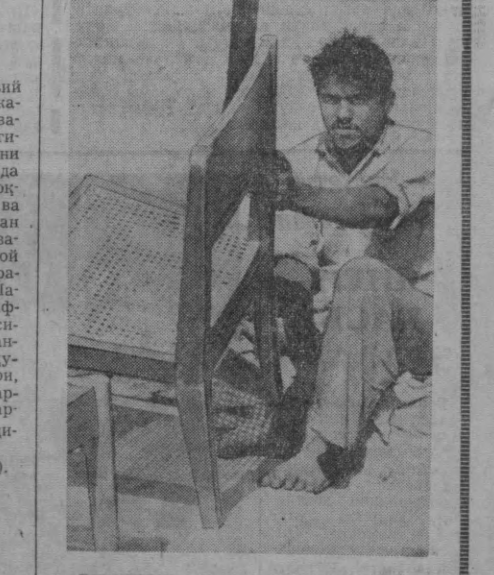
ПОКИСТОН. ҚАРАК. Жанубий шаҳарларда кўчада ҳаёт кечирилди. Очиқ ҳавода ҳар бир киши бақариб мушми.

«Бешқайрағоч» маснесида бир кўча бор, у Ўзбекистонда Совет тузумини мустахкамлаш ишига катта ҳисса қўшган револуционер ўртоқ Ермухаммедов номи билан юритилган.