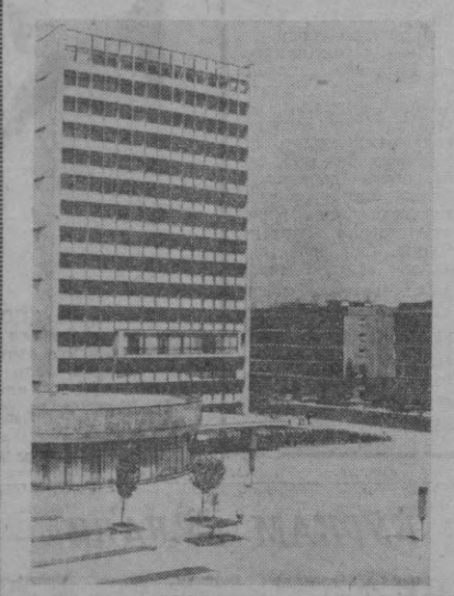
СУРАТДА: Болгариянинг янги саноат маркази ҳисобланган Дмитровград шаҳри.