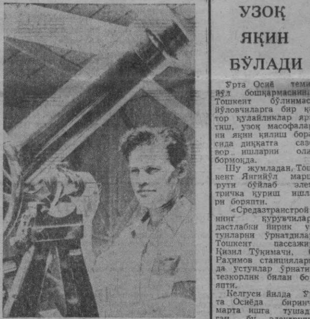
Ўзбекистон Фанлар академияси астрономия институтининг илим аҳли само жисмларининг физик ҳолатини ўрганиш ва уларнинг осмон сферасидаги ўрни ҳамда ҳаракатини топиш, шунингдек аниқ вақт ўлчовини белгилаш устида илмий тадқиқот ишлари олиб боради.

ЎЗБЕКИСТОН КП ТОШКЕНТ ШАҲАР КОМИТЕТИ ВА ТОШКЕНТ ШАҲАР СОВЕТИНИНГ ОРГАНИ