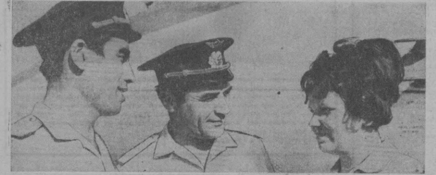
Ўзбекистон граждон ҳаво флоти территориял коллективни бугунининг Ҳаво Флоти кунини КПСС XXIV сьезди шарафига бошланган меҳнат вақтасида туриб меҳнат қилаётган ҳолда кутиб олмақда. Ҳар кун бу ердан етти мингларча тонна юк ташилмоқда.

мамлакатимиз авиаторлари ўзларининг анъанавий байрамлари — СССР Ҳаво Флоти кунини кўп шодоналик билан нишонламоқдалар. Барча совет кишилари қатори донаюрк учувчиларимиз ҳам бу байрамни партиязимнинг XXIV сьезди шарафига бошланган кўп миң кишилик коллектив мусобақасига қўшилган ҳолда кутиб олмақдалар.