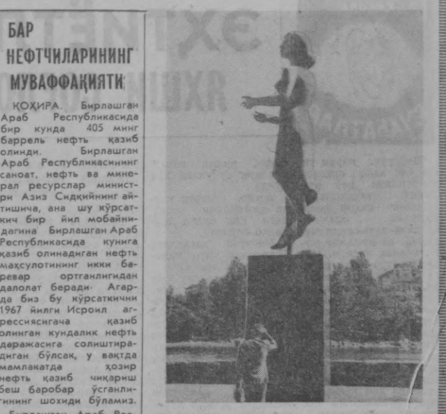
ХЕЛЬСИНКИ. Тинчлик монументи. Унга «Бу тинчлик монументи 1968 йил 6 апрелда Финляндия халқи томонидан Финляндия ва СССР халқлари ўртасидаги дўстликнинг рамзи сифатида бунёд этилган деган сўзлар фин ва рус тилларида ёзилган. СУРАТДА: ана шу монумент.

қилиқ куни муносабати билан ўтказилган тантанали маросимда айтди. Президент маржазий Африка республикасининг халқини бутун куч-гайратларини сарф қилишга даъват этди. Бокасса бу ерда маржазий Африка республикасининг миллий байрами — муста-