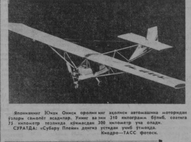
Япониянинг Юнхэ Окини оролининг аҳолиси автомашина моторидан ўзлари самолёт ясадилар. Унинг вази 310 килограмм бўлиб, соатига 75 километр тезликда кўнмасдан 300 километр уча олади. СУРАТДА: «Субару Плейн» денгиз устидан учиб ўтмоқда.

Сўнгра Индира Ганди Ҳиндистон турткини беш йиллик режани бажариш деганда иқтисодий юксалишининг белгиланган суръатларига (йилга беш процент) ва саноатда махсулот ишлаб чиқаришини йилга етти процент кўпайтиришга эришад, деб умид билдириди. Индира Ганди яна қўйдагиларни айтди: мустакил Ҳиндистон озиқ-овқат махсулотлари етиштиришда ўз тарихида биринчи марта режорда даражаси эришди — юз миллион тонна галла тайёрланди.