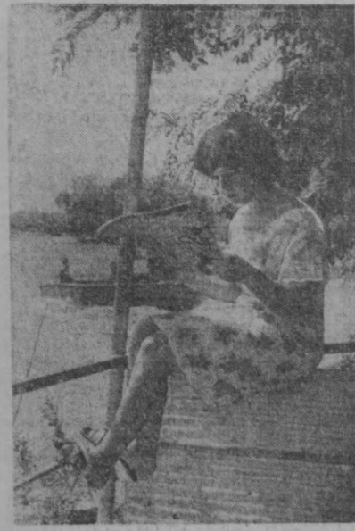
МУНЧА ҚИЗИҚАРЛИ.