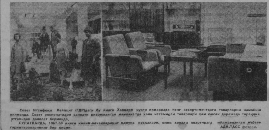
Совет Иттифоқи Лейпциг (ГДР)даги бу янги Халқаро кўзги ярмаркада кенг ассортиментдаги товарларни намойиш қилмоқда. Совет экспонатлари саноати ривожланган мамлакатда халқи истеъмолчи товарлари ҳам юксак даражада тарқайди. СУРАТЛАРДА: 1967.68 йилги кийим-кечакларнинг намуна нухсалари; ички хонали квартирага мўлжалланган мебель.