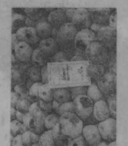
СУРАТДА: «Октябрь» колхоз бозорига очилган сабзавот, помидор маҳсулотлари, мева ва узум ямарнасидан сотилаётган маҳсулотлардан намуналар. Бу қуртлаган олмалар «ҳардорғир» лигидан буришиб-қуришиб ётибди.

Унинг ёнида генерал С. Раҳимов номли колхознинг дўкони жойлашган. Бу ерда ҳам энг сифатсиз картошканинг бир килограмми 11 тийиндан, қиринган олманнинг бир килограмми 25 тийиндан сотилмоқда. Калинин районига довг чингарган колхозларнинг аҳволи шуми?