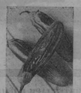
Қишга бақлажон қоқи қилувчилар шу ямарнага келсинлар. Қуртилган бақлажонлар натегорисига қараб 13-16 тийиндан сотилапти.

— Бугун ҳеч ким олмайди, — дейди сотувчи Э. Худойбердиев.