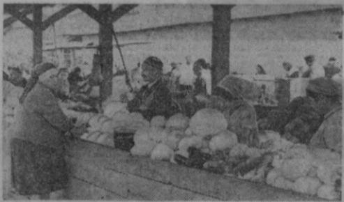
Мана, бозорнинг сабзавот маҳсулотлари билан савдо қилувчи асосий қисми. Бу ердаги асосий маҳсулотлар кишиларнинг шахсий томирларидан келтирилган. Аммо бу маҳсулотларнинг сифати яхши.