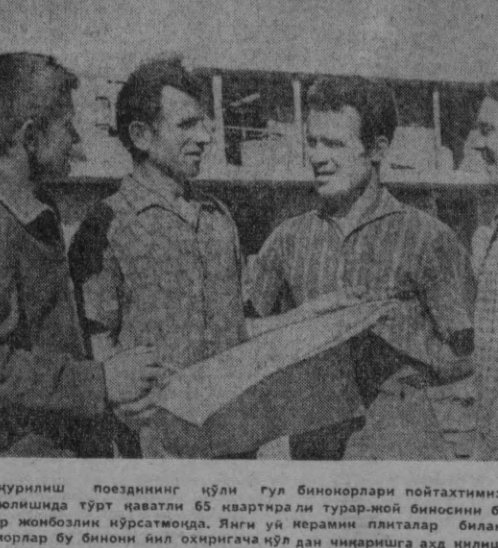
1-Киев кўрилиш поездининг қўли Гул буюмлари пойтахтимизнинг Кафанов ва Титов кўчалари муволиқда турт қаватли 65 квартиралар турар-ной буюмини бунёд этаётдилар. Бу ерда 50 буюмкор жонбозлик кўрсатмоқда. Янги уй керамин плиталар билан жиҳозланган бўлади.

Қаҳрамон шаҳар Волгограддан келган қурувчилар 400 кишидан иборат. Булар қаҳрамон шаҳарни тиклашда, унинг иқтисодий ва маданий ҳаётига асосий рольни ўйнашда кўрсатишган.