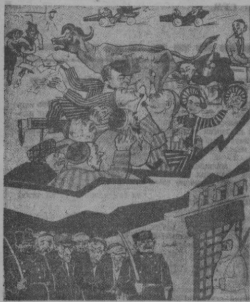
«Чайнамай еган, оргинай улар.»