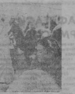
Сўлиган «барана» сабзавотни кўрган харидорлар теснари қараб ўтишди. Тагин унга 15 тийин нарх қўйилган. Шу нархда харидорлар бозордан сабзавотни тандаб олиш япти.