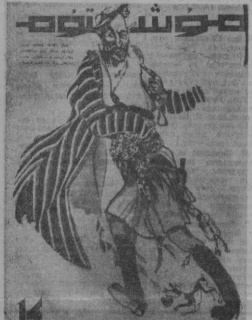
Кейинги вақтларда чапанлар, безорилар ўртасида мастлик билан мушталашилар, пичоқ уришлар кўрина бошлади. Миличия идоралари бунга натта эътибор қилмайдилар. — Худоб талба, шаҳарнинг тўпни қилиб икйвораман! Азбори худоб, бу юрак миллиционерни менга ни почом...