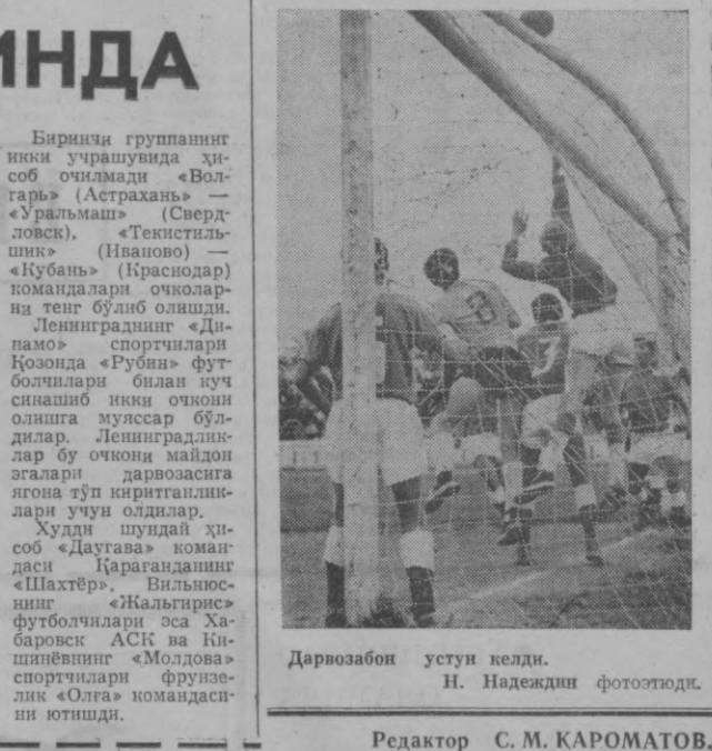
Дарвозабон устун келди.