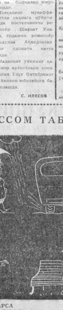
ЗОНТИК КҮП ЯХШИ НАРСА