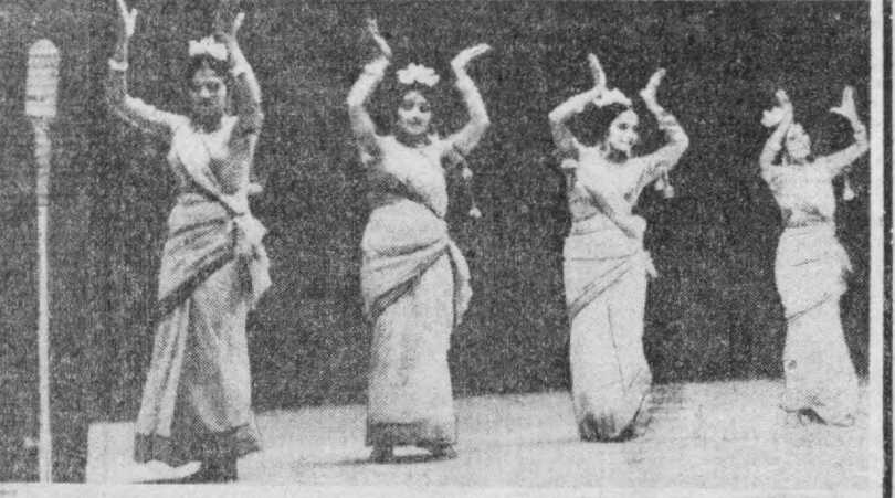
Суратда: (чавда) таниқли покестовик ашулачи Мустафо Жамон Аббосий, (ўнгда) рақосалар шарқий Покистон рақсини ижро этмоқдалар.