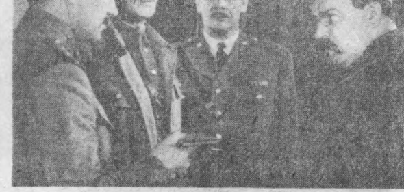
Сценарий авторлари: А. Кулешов, М. Лужанин. Постановкачи режиссёр В. Корш-Саблин. Бош оператор Ю. Фогельман. Постановкачи ассом А. Альбинский. Композитор Е. Глебов. Ролларни икром атувчилар: Юрий Пузырев, Александр Попов, Светлана Макарова, Фанна Никитина, Владимир Белокоров, Николай Еременко, Лев Золотухин, В. Емельянов ва бошқалар. «Белорусфильм» киностудияси маҳсулути. 1967 йил.