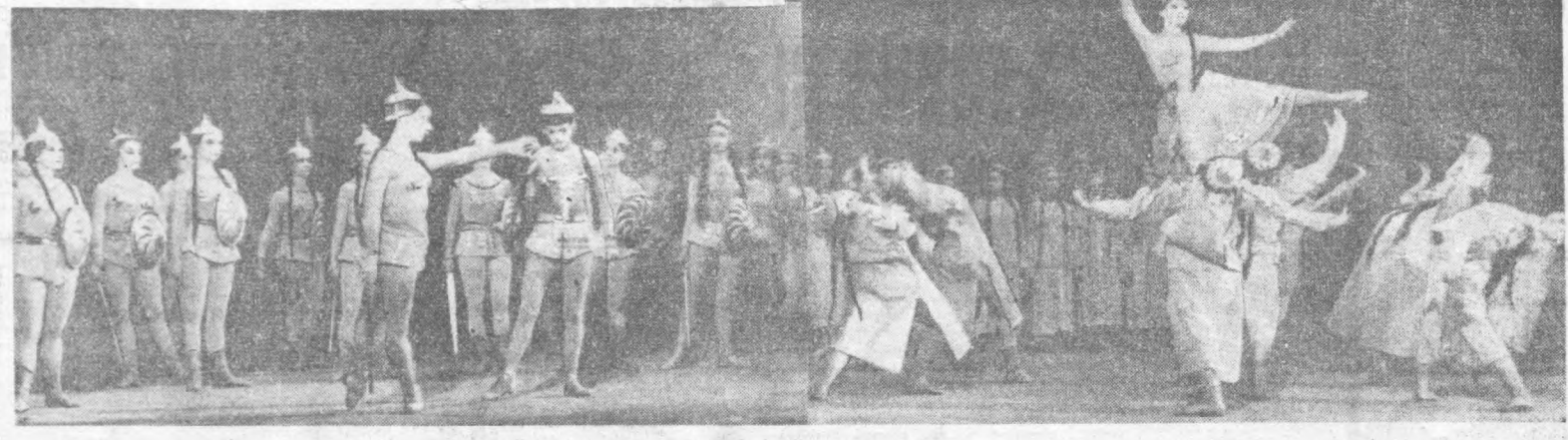
Қорақалпоқ эпоси — «ҚИРҚ ҚИЗ» мотиви бўйича А. КУЗНЕЦОВ либретоси. Саҳналаштирувчи Ўзбекистон ССР да хизмат қўрсатган артист А. КУЗНЕЦОВ. Дирижёр — Д. АБДУРАҲМОНОВА. Рассомлар — Ўзбекистон ССР да хизмат қўрсатган санъат арбоби А. ВИЗЕЛЬ ва С. САМОХВАЛОВ.