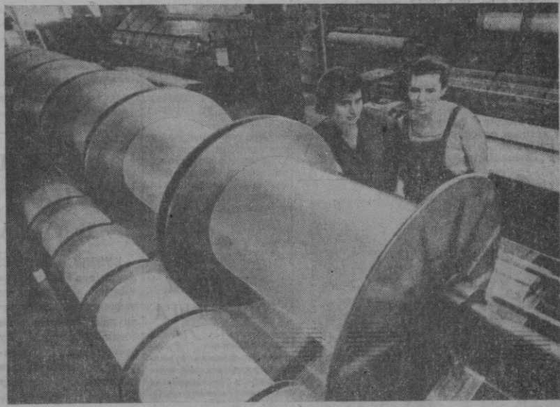
Тошкент трикотаж фирмасининг коллектив янги трикотаж маҳсулотлари ишлаб чиқара бошладилар. Бу маҳсулот ўзининг чиройлиги ва сифатлиги билан ажралиб туради.

Ўзбекистон Марказий Комитети Шайхунининг ширкати ишлаб чиқариш территориясида том маъноси билан ширкати, янги корхона қурилиши низомига етказилмоқда.