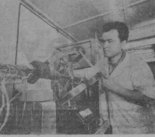
Ўзбекистон Фанлар Академияси электроника институтининг илмий ходимлари халқ хўжалиги учун катта аҳамиятга эга бўлган кўплаб илмий тадқиқот ишлари устида бoш қoғир моқдaлар.

Фирмага чет аллардан ҳам маҳсулотлар келиб туради. Яқинда Италия чеvarлари бир партиа шерсть матоси юборилди.