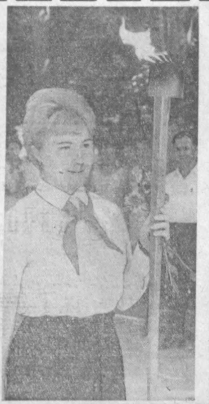
Биродарлар қабристонини... Бу жой ҳар бир тошнинг учун муқаддас бўлиб қолган. Пионерларнинг тантанали Янгиларнинг, комсомол билетларини олиш тантаналари шу ерда ўтказилиши одат тусига кириб қолган. Бу йилдан бошлаб эса яна бир янги аъзона туғилди. Ленин районининг старший пионер вожатийлари шу ерда 1917 йил октябрида ёзилган оталар машаълини қўлданди, қўлга бериб, олға босишга қасам ичдилар.