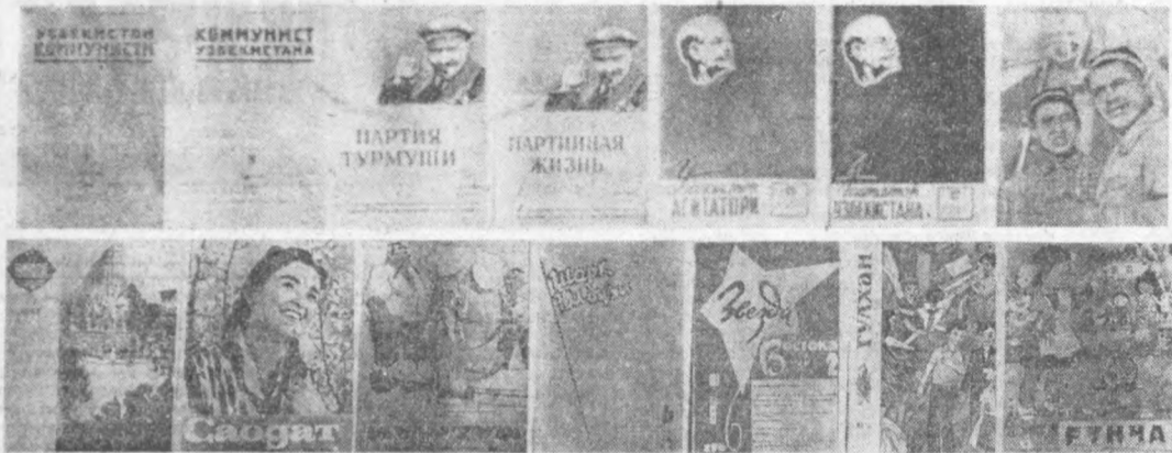
Обуна «Союзпечать»нинг ҳамма бўлимларида, алоқа узеллари ва бўлимларида қабул қилинади.