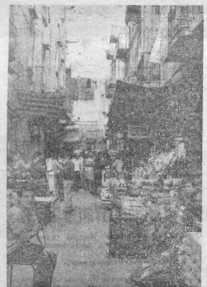
ИТАЛИЯ, Неаполь — Жанубий Италиянинг энг йирик порт шаҳри...