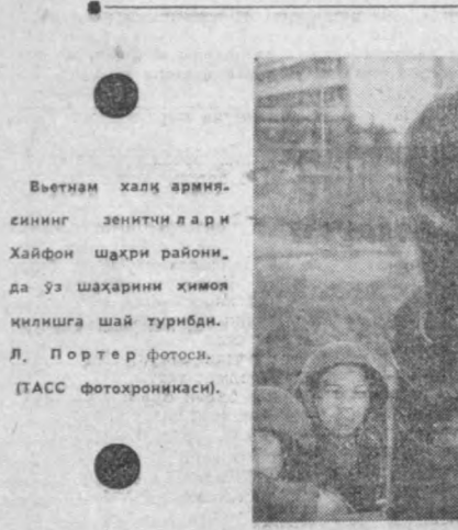
Вьетнам халқ армиясининг зенитчи ва янги Хайфон шаҳри райони...

ЖАНУБИЙ ВЬЕТНАМ ВАТАН-ПАРВАРЛАРИНИНГ ҲУЖУМИ