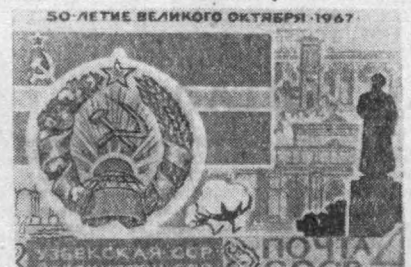
50-ЛЕТИЕ ВЕЛИКОГО ОКТЯБРЯ 1967

«Узремпробор» заводининг маҳсулотларидан бир неча партияси яқинда Венгрияга жўнатилди. Ишлаб чиқарилган маҳсулотларда корхонанинги йиғув цехи фидокорларининг ҳам катта ҳиссаси