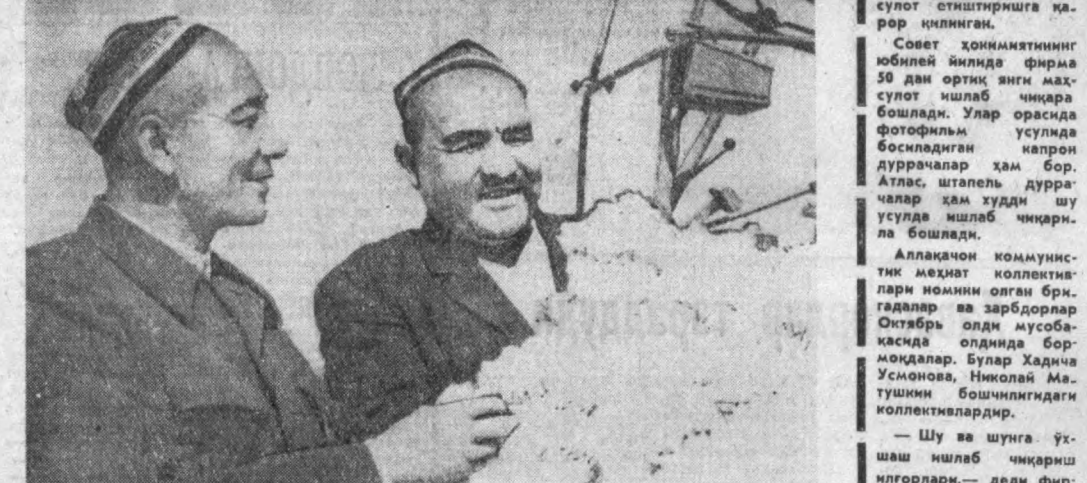
Республикамизнинг пахта далаларида юбилей йили ҳосилнинг йиғиб-териб олиш қизғин давом этмоқда.

Янгиўл районидидаги Ҳамроқул Турсунқулов номли колхоз аъзолари ҳар гектар майдондан 30 центнердан оқ олтун териб олиш бўйича давлат планини муваффақият билан бажариб, юбилейга яна гектар бошига 10 центнердан пахта ҳосили йиғиб-териб олиш бўйича зиммаларига олган социалистик мажбуриятларини муваффақиятли эдо этиш учун фидокорона меҳнат қилаётдилар.