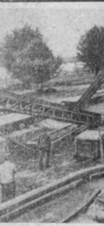
Германия Демократик Республикасида ҳосил қилинган йиғиштириб олиш, лашган усуллар кенг қўлланылмоқда. Суратда: Стававолагги Нойбранденбург округи) олти хўжалиқдан ташкил топган саралаш пунктида 24 киши бир соат ичиде 15,20 тонна қудулпнайин саралайдилар.

Артидан, Чан Кай-ши найфитининг ахшилигининг ҳам, унда «итидаги» қайтиш плани яна лайдбо бўганининг ҳам сабаби ана шу бўлса керак. (НОВОЕ ВРЕМЯ-дан).