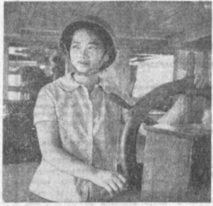
ХАНОЙ. Қизил дарё сувларида қиларининг икки натори жавлон уради, Вьетнамлик қизлар матрослик мутахассисини анча пухта оғалашган. Улар мурракш шаронда техникани яхши бошқара оладилар.

Бирмаллик марварид кидирувчилар яримта гугурт қутисидек, оғирлиги 36,75 грамм келадиган марварид донеси топдилар. Бу дундаги энг йирик марваридлар.