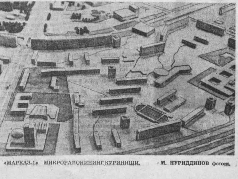
«МАРКАЗ-1» МИКРОРАЙОННИНГ КўРИНИШИ.

Ҳозирги кунда фойе деворларига янги стейндлар қўйилмоқда. Улар Ўзбекистон музика маданиятининг 50 йил мобайнида бош иб ўтган кўнчилиқ ҳақида қўйилган ҳақиқатларни кўрсатди. Тўғри, бу стейндлар орасида Шалипини, Шостакович ва Рихтер йўқ. Лекин Ру-ган. Ўқув юртларида, Козловский, Григорий Александрович Мушель, Григорий Сергеевич Израэлев ва бошқалар ҳам камиди ўттиз йиллик таърибасига эга. Улар республикада хизмат кўрсатган санъат арбоби деган шарафли номин олиш-тер йўқ. Лекин Ру-ган. Ўқув юртларида,