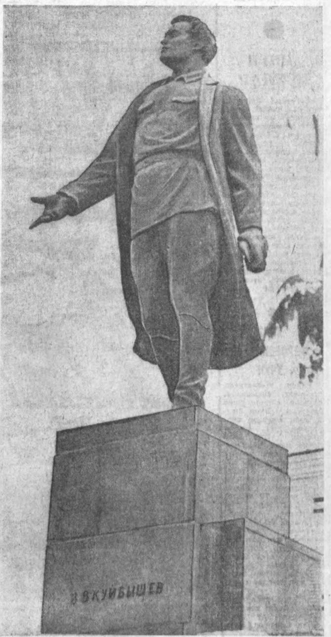
Тошкентда В. В. Куйбишевга ўрнатилган ҳайкал.

Куйбишев район меҳнаткашлари район партия ташкилоти раҳбарлигида янги беш йиллик режаларини муваффақиятли равишда амалга оширмоқдалар ва катта юксалишлар йўлидан дадил бораверадилар.