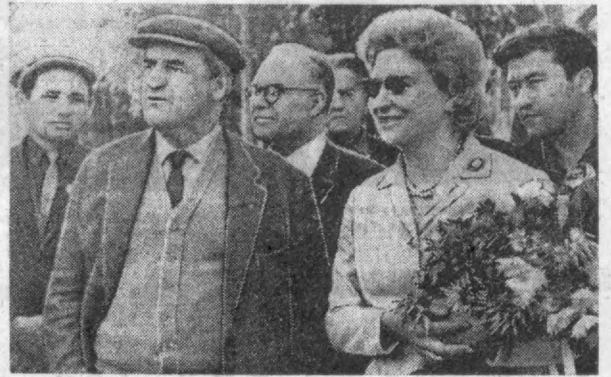
Суратда: Т. М. Фрунзе Октябрь революцияси номли заводда.

«Тошкент оқшомини» газеталарини яқинлаштириб келайотган Улуғ байрам билан чин қалбидан табриллашди ва жасрат шахрининг аҳолисига меҳнатда буюк муваффақиятлар ва шахсий ҳаётларида катта бахт тилайман.