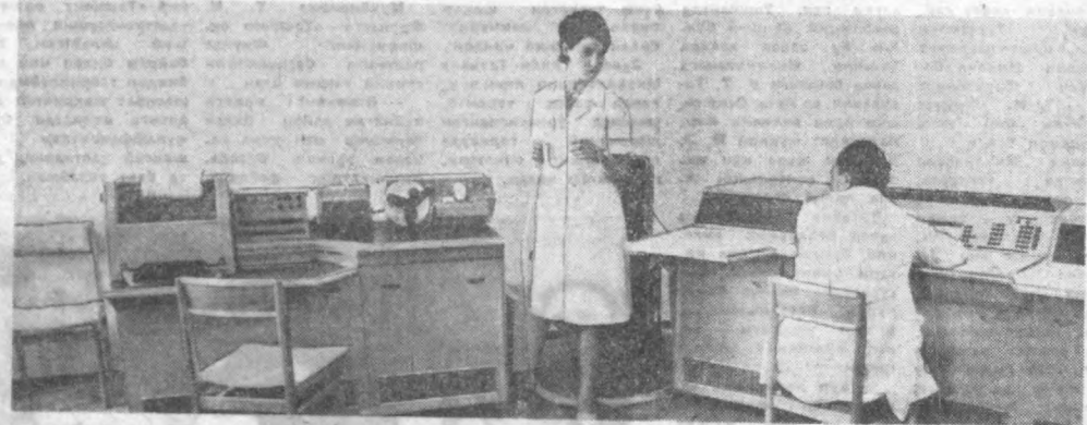
Ереванлик инженерлар ва математиклар томонидан яратилган «Наир-2» янги электрон-хисоблаш машинаси. Бу машина инженерлик ва илмий масалаларни нeнг миксда ҳал қилишга мўлжалланган.