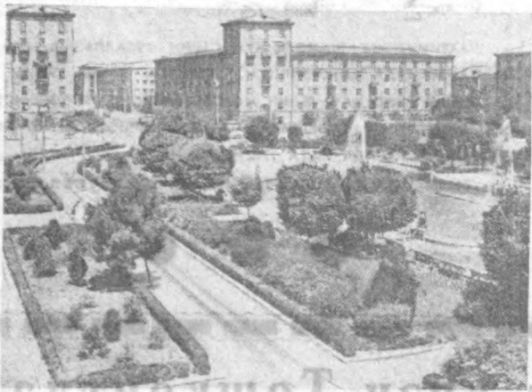
Ереван, Спандарян номидagi май дoнинг кўриниши.