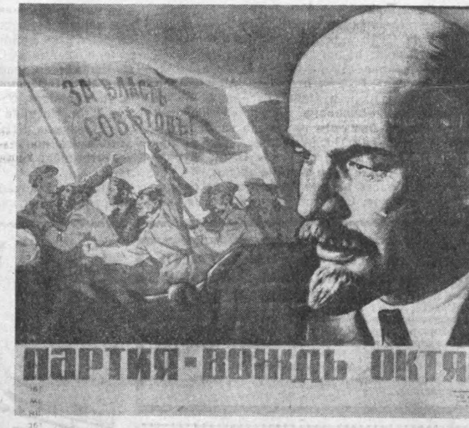
Рассом Л. Головановнинг «Советский художник» нашриётида Совет ҳоқимиятининг 50 йиллигига бағишлал чикарилган плакати.

да уни ушлаб олишганини билдик. Лу-суиғу болага жаҳл билан қараб: — Уч кундан сўнг уласан,— деди.