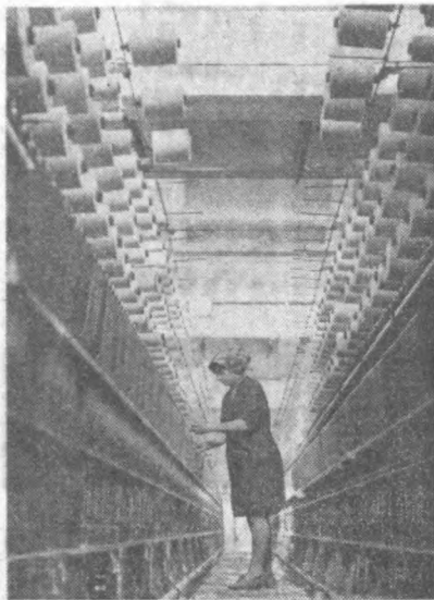
Ереван тўқимачилик комбинатларининг бирида.